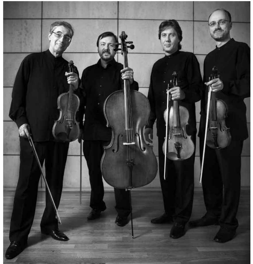
Eine russische Nachtmusik für Echternach: Das „Borodin String Quartet“ gastiert an diesem Freitag, dem 17. Juni im Trifolion auf. Im Rahmen des Internationalen Festivals Echternach.