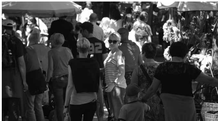
La traditionnelle Fête de la nature, avec ses animations pour petits et grands dans un cadre idyllique, ouvrira ses portes ce samedi 18 juin et battra son plein jusqu'à ce dimanche 19 juin.