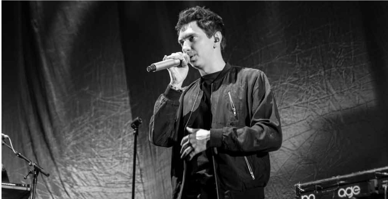
Der österreichische Singer-Songwriter Julian Le Play wird dieses Jahr Düdelingen beglücken.