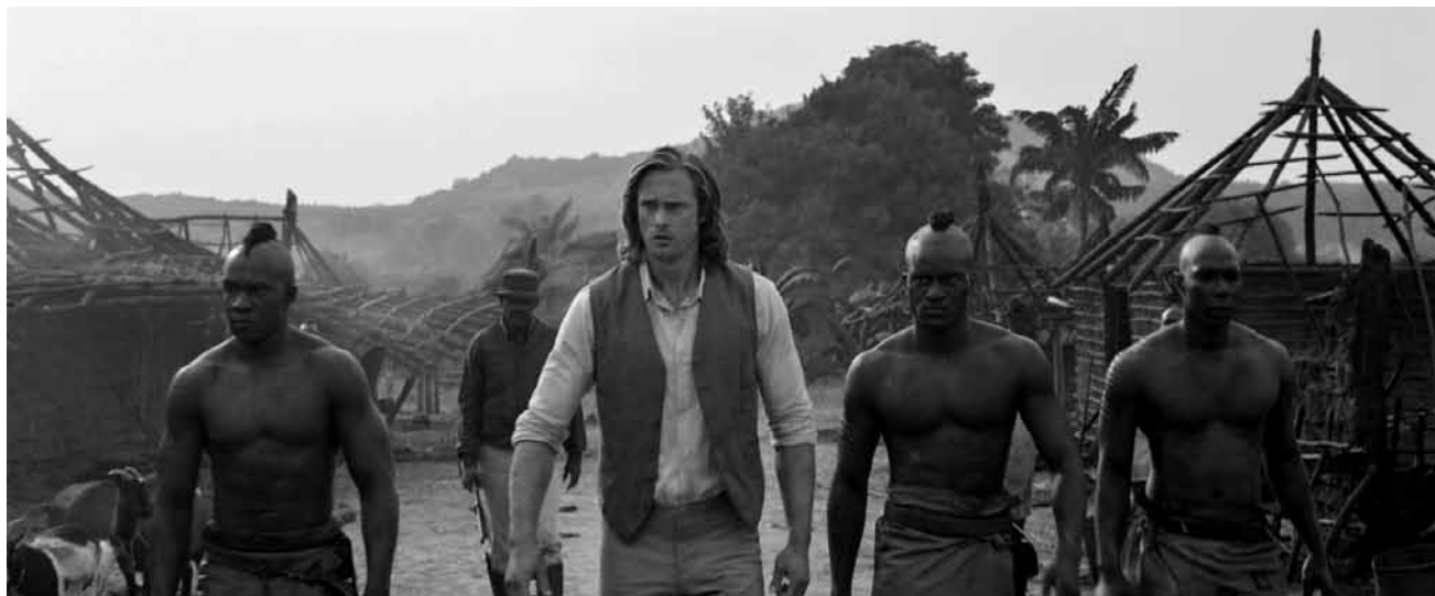
Legendär war Tarzan immer schon. Weshalb man sich fragen kann was an „The Legend of Tarzan“ so außergewöhnlich sein soll - außer Christoph Waltz als Bösewicht, natürlich. Neu im Utopolis Belval und Kirchberg.

XX (...) démonte très bien le mythe d'une banque responsable, tout en racontant une intrigue passionnante. (lc)