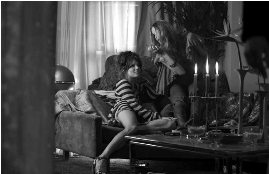
Esthétique Seventies et lutte des classes pour une dystopie qui regarde en arrière.