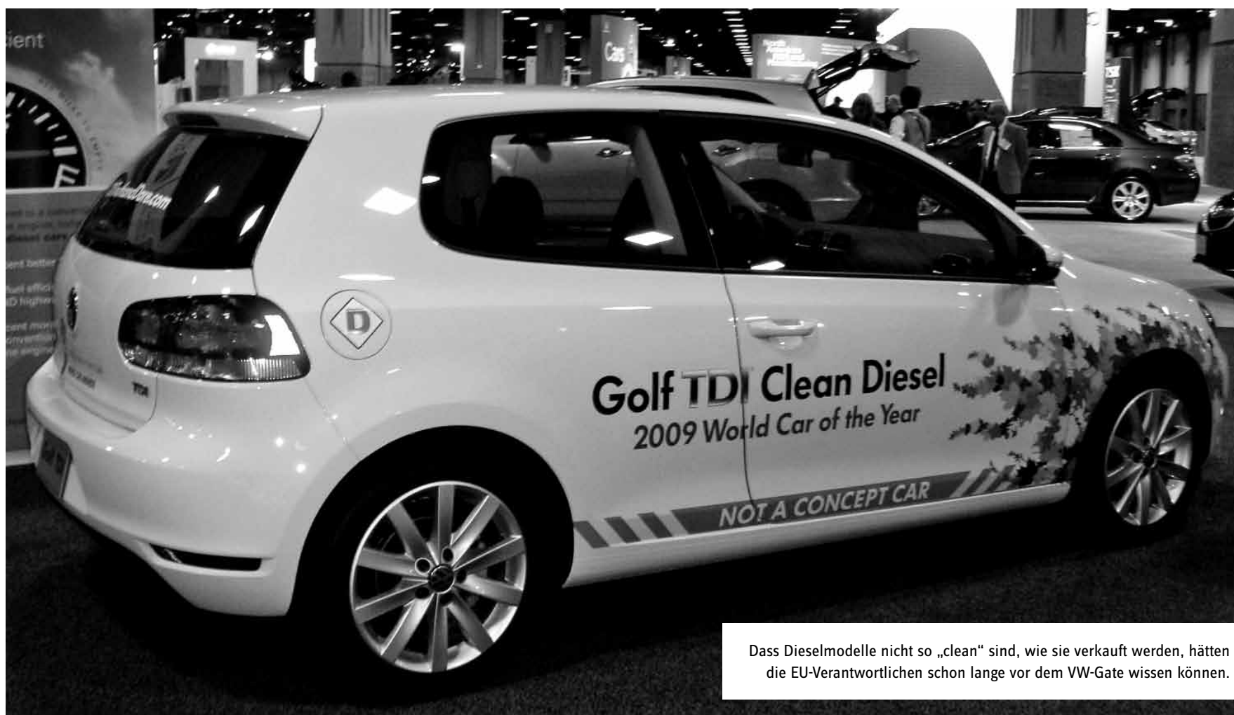
Dass Dieselmotoren nicht so „clean“ sind, wie sie verkauft werden, hätten die EU-Verantwortlichen schon lange vor dem VW-Gate wissen können.

schließen konnten“, sagt Rebecca Harms, Europa-Abgeordnete der Grünen.