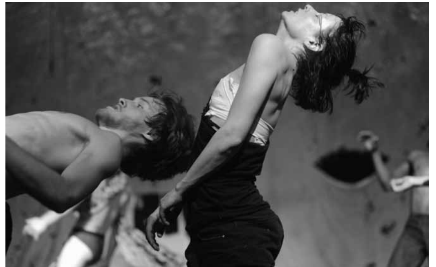
Le message est clair - même en allemand - « Nicht schlafen », chorégraphie par les ballets C de B, à la maison de la culture d'Arlon ce samedi 10 décembre.