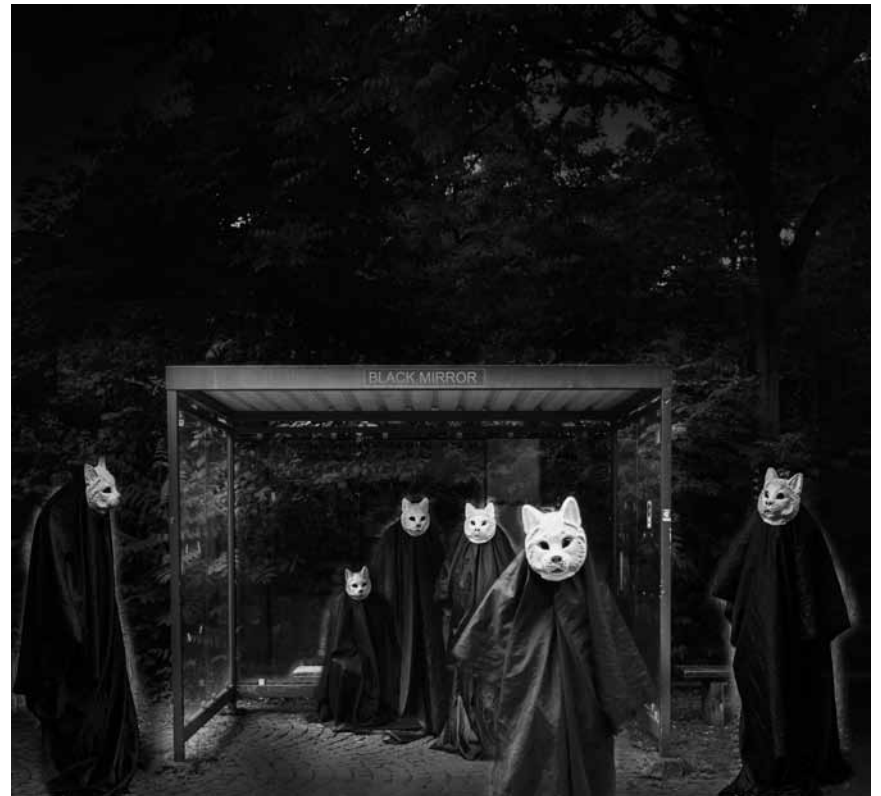
Les fantômes ne sont pas que dans l'opéra au Luxembourg : « Black Mirror », concert installation, aura son départ devant la Philharmonie ce vendredi 9 décembre.