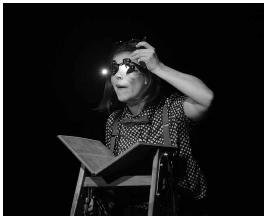
Fir déi Kleng an déi Klengbliwwen : « Di rout Spillauer », dësen Samsdeg 10 Dezember am Cape.

Generation Gospel , église Saint-Joseph, Esch-sur-Alzette , 16h.