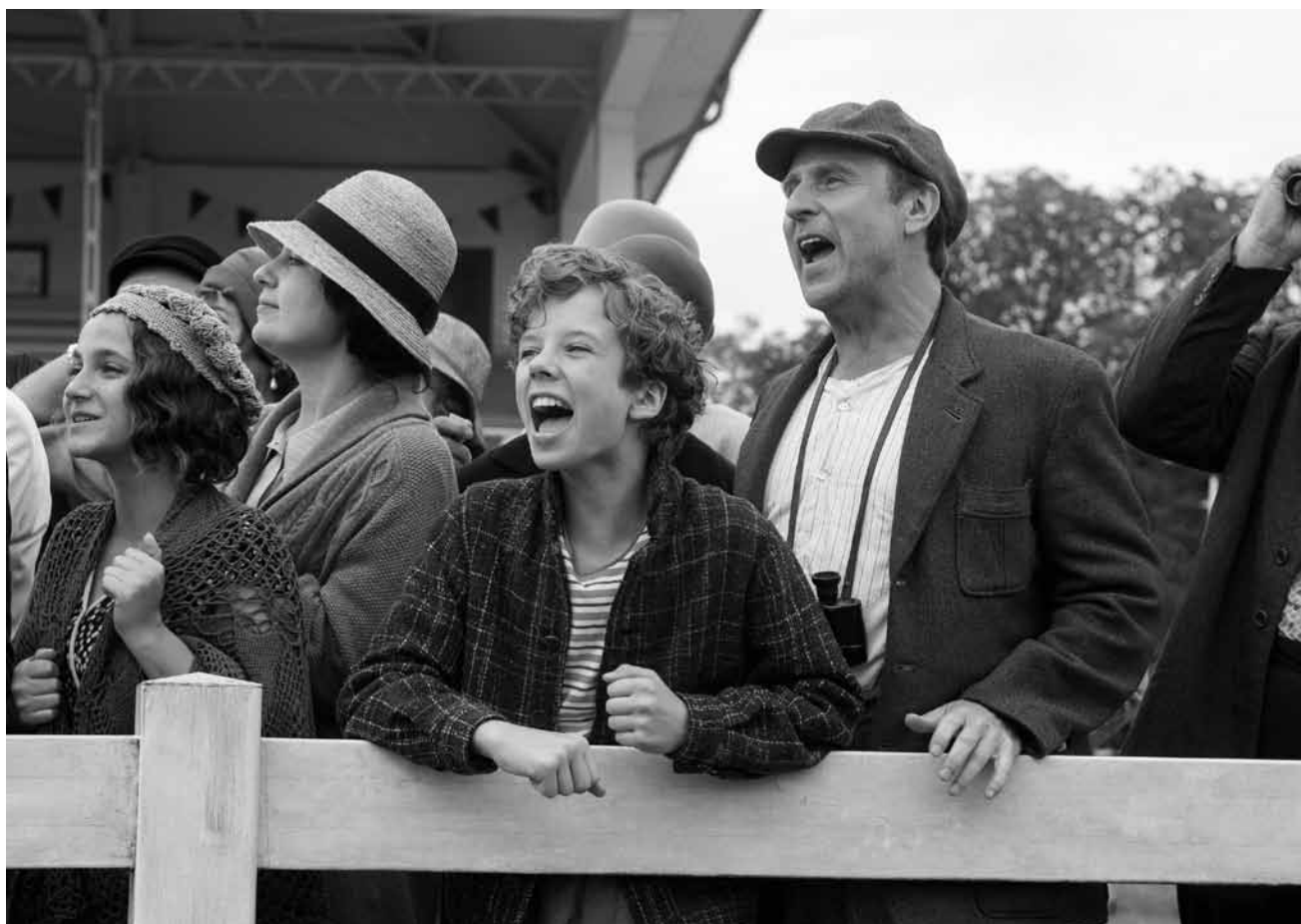
Das wird ihm sicher noch vergehen: „Timm Thaler und das verkaufte Lachen“, Kinderfilm neu im Utopolis Belval und Kirchberg.

Lindsay Mills - und flieht wenig später nach Russland, gejagt von US-Geheimdiensten: Edward Snowden tauscht seine Arbeit als IT-Spezialist, sein Privatleben und seine Freiheit gegen das Exil, weil er irgendwann nicht mehr dazu schweigen will, dass die NSA in Kooperation mit anderen Geheimdiensten das Internet zu einer Sphäre weltweiter Massenüberwachung pervertierte, unter Duldung der Politik.