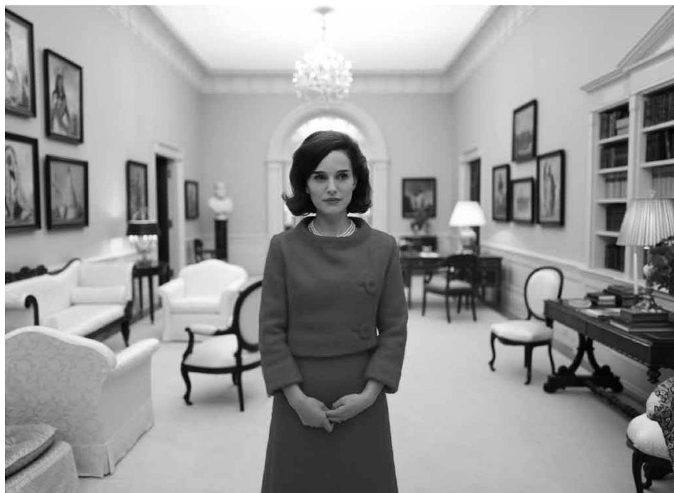
Ein Leben zwischen Schein und Sein - Nathalie Portman ist „Jackie“, neu im Utopia und im Utopolis Kirchberg.

Als John F. Kennedy im Januar 1961 sein Amt als 35. Präsident der Vereinigten Staaten von Amerika