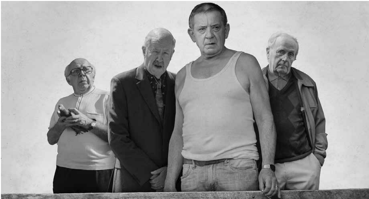
Die vier Helden in „Rusty Boys“ lassen sich nicht so leicht von ihrem Vorhaben abbringen.