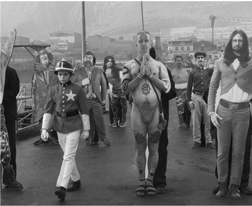
Une autobiographie rêvée où tout se passe mieux qu'en réalité : « La danza de la realidad », d'Alejandro Jodorowski - mercredi à la Cinémathèque.

Dans un train en partance pour Pékin, le destin de quatre voyageurs se lie intimement : Shanghai Lily y retrouve son ancien amour Harvey, mais doit se soumettre aux désirs du meneur révolutionnaire Chang afin de sauver la vie de Harvey. Elle est secourue par la belle et énigmatique Hue Fei.