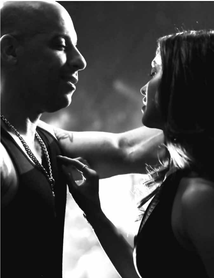
Geheimdienstarbeit, wie sie sich wahrscheinlich auch Donald Trump vorstellt: „XXX 3 - The Return of Xander Cage“ - in fast allen Sälen.