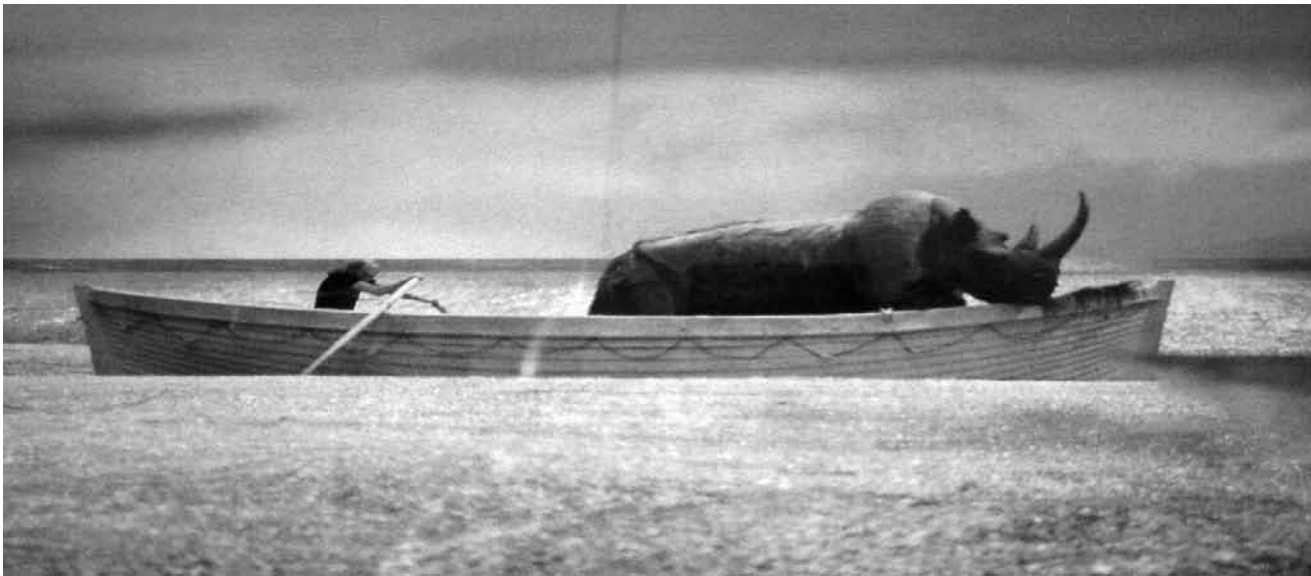
L'excentricité excessive de Fellini : « E la nave va » - dimanche à la Cinémathèque.

The Conversation USA 1973 de Francis Ford Coppola. Avec Gene Hackman, John Cazale et Allen Garfield. 109'. V.o., s.-t. fr.