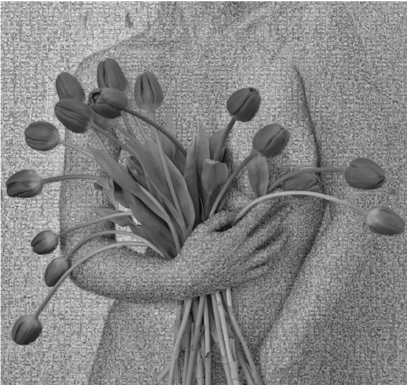
Des poussières et bien plus à voir à la galerie Schortgen en ce moment : « All is Dust » de Samuël Levy, jusqu'au 1er avril.

NEW galerie Schortgen (24, rue Beaumont, tél. 26 20 15 10), du 11.3 au 1.4, ma. - sa. 10h30 - 12h30 + 13h30 - 18h.