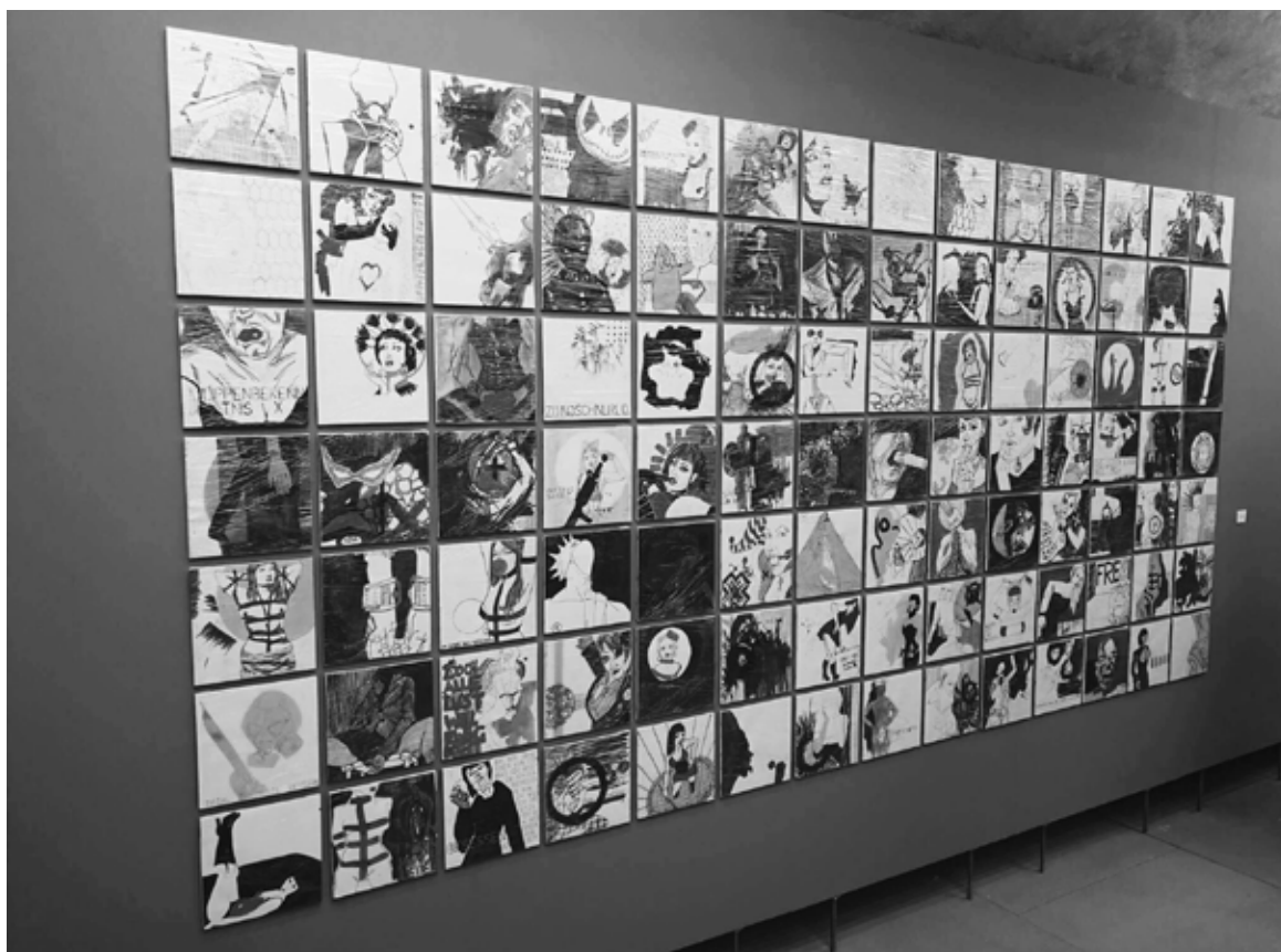
In der Ausstellung „Sweet Dreams?“ dreht sich alles um mit Körpern verbundenen Sehnsüchte, Ängste, Zweifel und Normen.