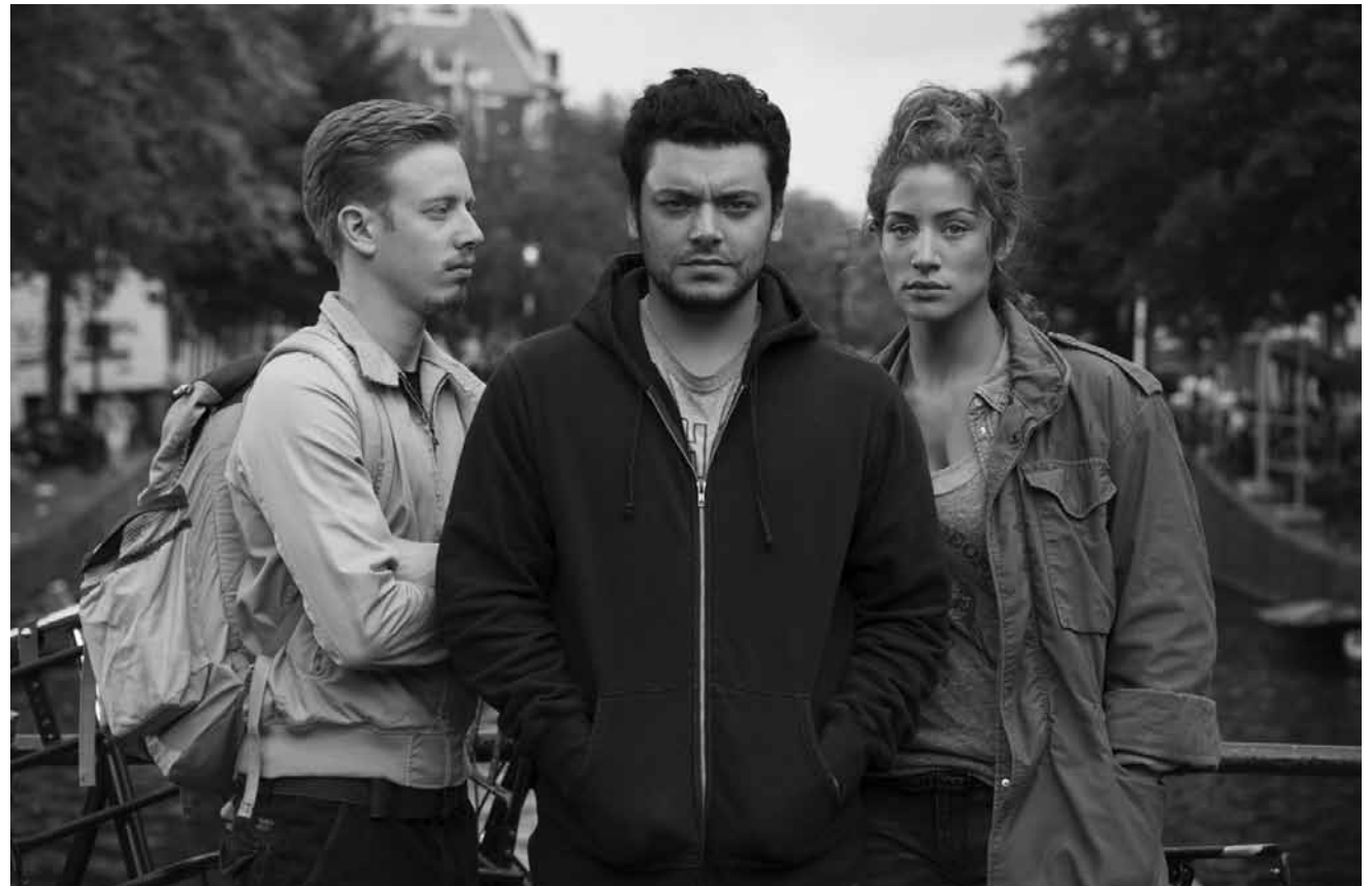
Attention : pluie de clichés annoncée ! « Gangsterdam », nouveau à l'Utopolis Belval et Kirchberg.

✂✂ Weniger ein historisches Porträt, fokussiert dieses Drama vielmehr auf die Psyche Jacqueline Kennedys unmittelbar nach der Ermordung ihres Ehemannes. Teils in extrem nahen Einstellungen gefilmt, ist „Jackie“ allerdings nicht so sehr ein Film über die ehemalige First Lady als ein Vorzeigeprojekt von Natalie Portmans beeindruckendem Schauspielertalent. (tj)