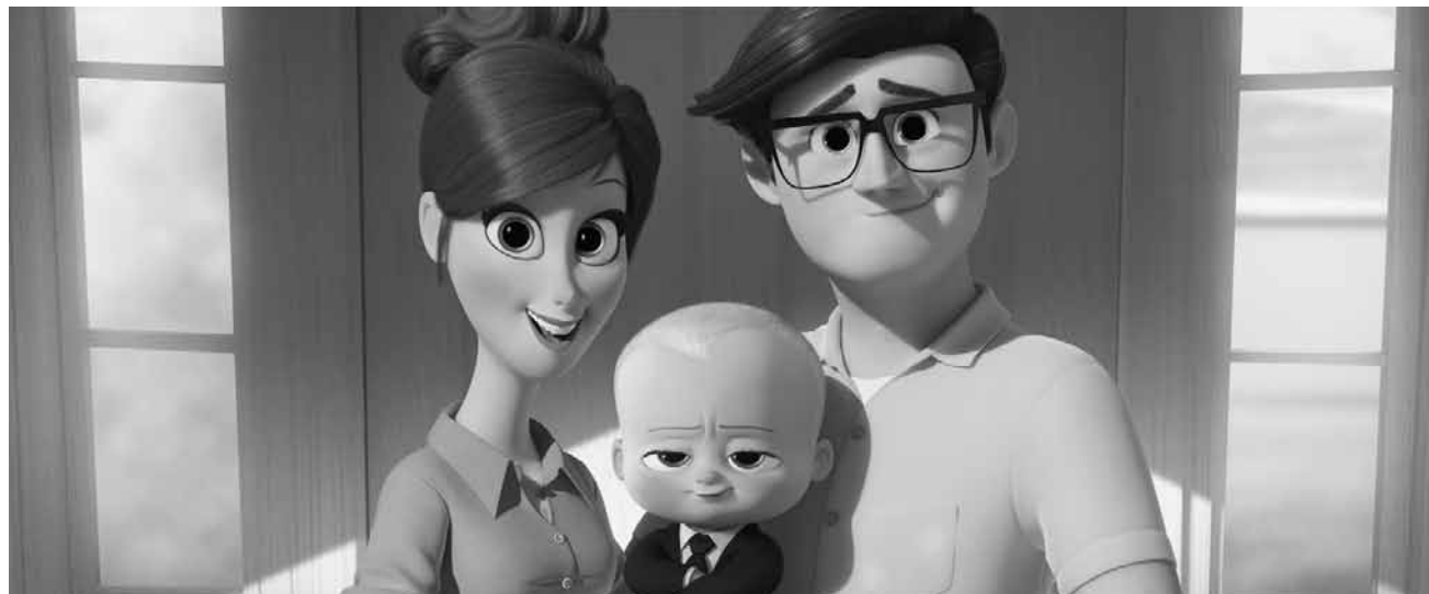
Ein überkapitalistisches Baby versucht eine Familie zu übernehmen - fast wie im richtigen Leben... „The Boss Baby“ neu in fast allen Sälen.

Koala Buster Moon leitet ein Theater, um das es nicht sonderlich gut bestellt ist. Als er merkt, dass er ohne Anstrengungen nicht aus den roten Zahlen kommt, ruft Buster kurzerhand zu einem Gesangswettbewerb auf. Gemeinsam mit seinem Freund Eddie einem schwarzen Schaf, lädt er zum Vorsingen. Unter den Teilnehmern des Wettbewerbs sind der rappende Jung-Gorilla Johnny, die alleinerziehende Schweine-Mama Rosita, die betrügerische Jazz-Maus Mike, die unter Lampenfieber leidende Elefanten-Teenagerin Meena und Stachelschwein-Weibchen Ash, das seinen arroganten Freund loswerden will. Jedes der stimmungsvollen Tiere träumt von der großen Karriere.