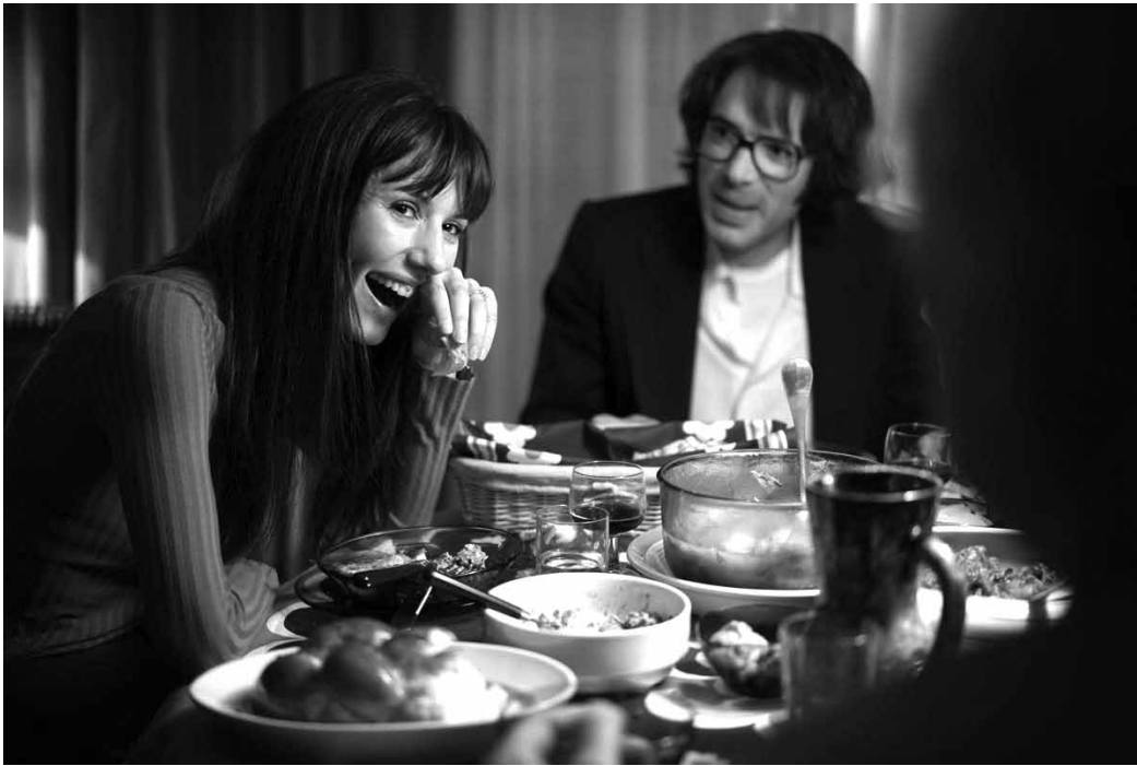
Au début, quand tout est encore amour.