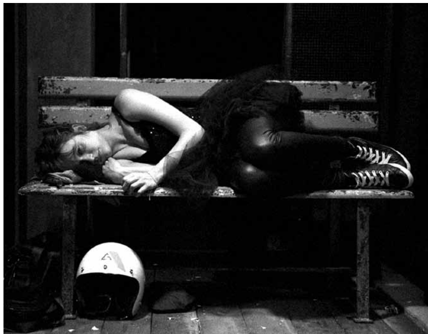
Une histoire d'amour adolescente et... bretonne : « À la renverse » sera aux Rotondes les 3 et 4 avril.

Breathing Vibrations , yoga and music connected, by Lex Gillen and Chrëscht Cornette, Kass-Haff, (187a, rue de Luxembourg), Rollingen , 19h - 20h.