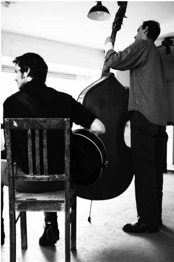
Zwei Männer mit Kontrabass und Gitarre ... kein Chinese dabei.