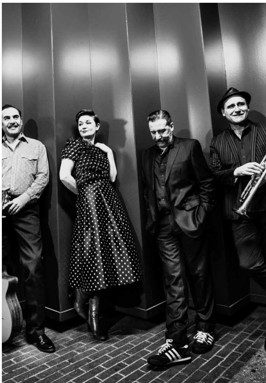
Ettelbruck s'éveille... avec le « Paris Combo » qui viendra donner du sien le 6 avril au Cape.

Un musée vivant , performance, galerie 1 au Centre Pompidou, Metz (F), 10h. Tél. 0033 3 87 15 39 39.