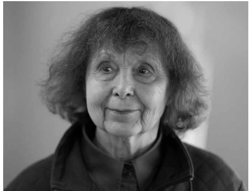
La compositrice russe Sofia Gubaidulina est mise à l'honneur des violoncellistes de l'Orchestre philharmonique du Luxembourg - ce vendredi, 17 février à la Philharmonie.