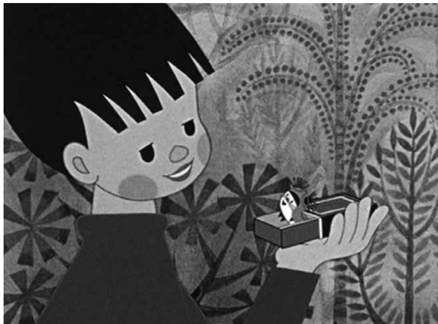
La vie d'insecte est fascinante dans « Sametka, la chenille qui danse » - aux Starlight, Utopolis Belval et Kirchberg.

Fifty Shades Darker Manchester By the Sea Paterson Rusty Boys The Lego Batman Movie Un sac de billes Vaiana Wendy XXX 3: The Return of Xander Cage