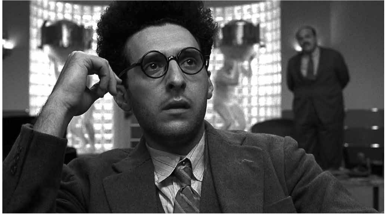
Drehbuchautoren in Hollywoodfilm: Die Meta-Ebene erreicht Joel Coen in seinem Film „Barton Fink“ am Freitag in der Cinémathèque.

A Tulsa, à la fin des années 1950, deux bandes d'adolescents s'affrontent.