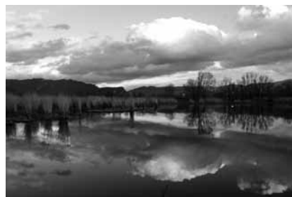
Schilf-Idylle. Nach welchen Kriterien könnte ihre Zerstörung „kompensiert“ werden?