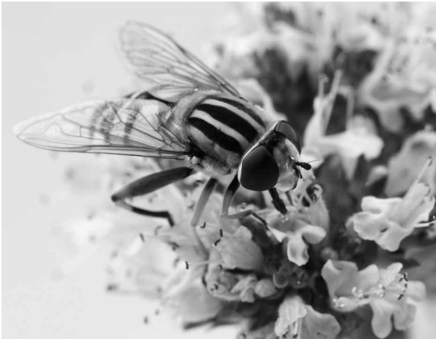
Mal von ganz nah zu betrachten: „Porträts unserer Insekten“ von Alain Schumacher - bis zum 11. März im Trifolion in Echternach.

(montée du Château, tél. 92 96 57), Clervaux, me. - di. + jours fériés 12h - 18h. Fermeture annuelle jusqu'au 28.2.