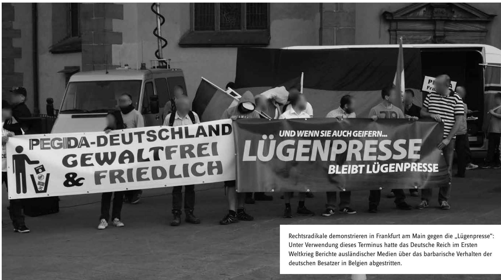
Rechtsradikale demonstrieren in Frankfurt am Main gegen die „Lügenpresse“: Unter Verwendung dieses Terminus hatte das Deutsche Reich im Ersten Weltkrieg Berichte ausländischer Medien über das barbarische Verhalten der deutschen Besatzer in Belgien abgestritten.

Die eine richtet sich daher via Facebook in der „filter-bubble“ ein, in der man den gemeinsamen Standpunkt möglichst störungsfrei reproduziert. Der andere bastelt derweil gleich an einer ganzen Verschwörungstheorie, die es erlaubt, die gesellschaftlichen Verhältnisse auf einen vergleichsweise einfachen Nenner zu bringen, der die Konfusion in der Welt, die Ursachen für eigenes Elend, scheinbar erklärt und dadurch ein bisschen erträglicher macht.