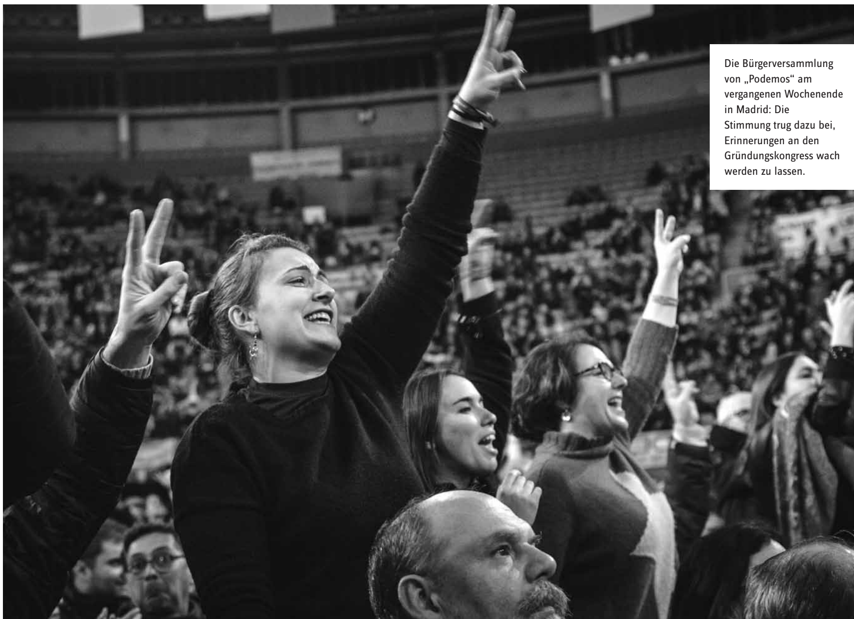
Die Bürgerversammlung von „Podemos“ am vergangenen Wochenende in Madrid: Die Stimmung trug dazu bei, Erinnerungen an den Gründungskongress wach werden zu lassen.