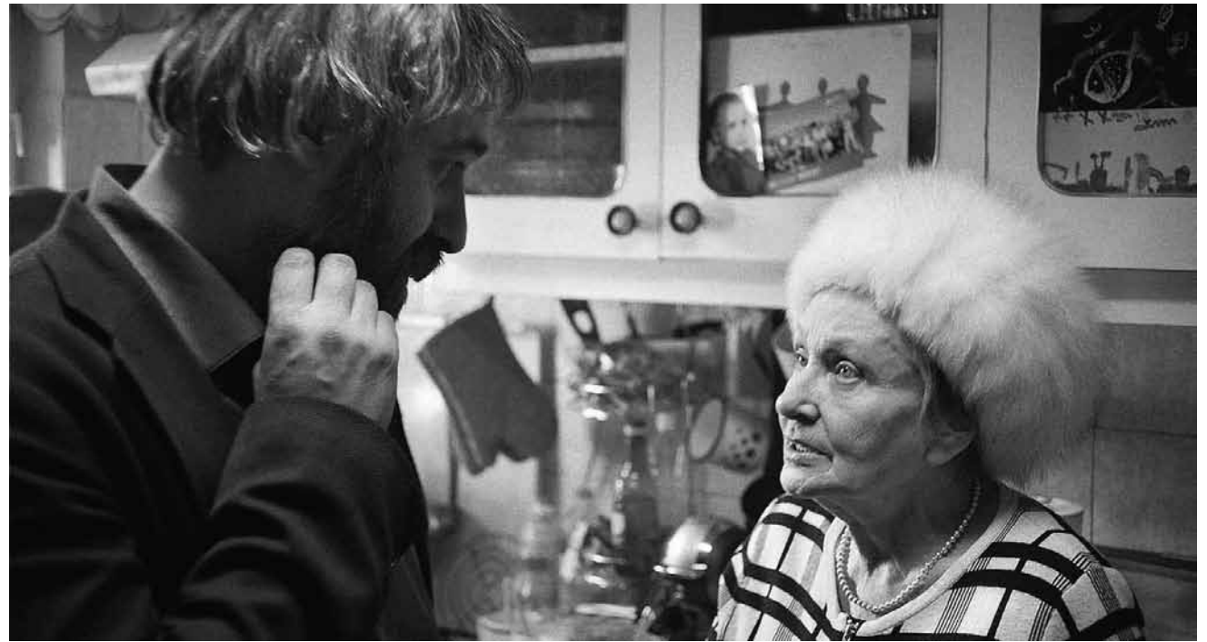
Die liebe Familie strapaziert die Nerven des erfolgreichen rumänischen Arztes Lary - „Sieranevada“ neu im Utopia.

Elle prend son vélo et traverse son quartier, vide. Tout le monde a disparu. Se pensant l'unique survivante d'une catastrophe inexplicable, elle finit par croiser quatre autres jeunes: Dodji, Yvan, Camille et Terry. Ensemble, ils vont tenter de comprendre ce qui est arrivé, apprendre à survivre dans leur monde devenu hostile... Mais sont-ils vraiment seuls?