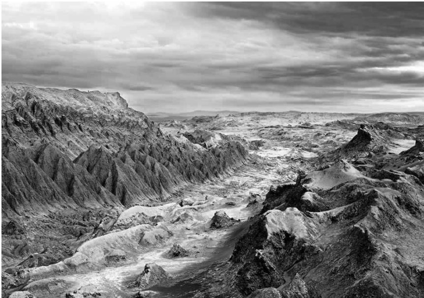
S'est-il laissé s'inspirer par les plans d'Étienne Schneider ? « Space Project » - les photographies de Vincent Fournier sont à l'Échappée belle à Clervaux jusqu'au 29 septembre.

Musée national de la Résistance (place de la Résistance, tél. 54 84 72), Esch-sur-Alzette, ma. - di. 14h - 18h. Musée national d'histoire naturelle (25, rue Münster, tél. 46 22 33-1), Luxembourg, me. - di. 10h - 18h, ma nocturne jusqu'à 20h. En raison de la phase finale du réaménagement des expositions permanentes, le musée sera fermé au public jusqu'à mai 2017. Musée national d'histoire et d'art (Marché-aux-Poissons, tél. 47 93 30-1), Luxembourg, ma., me., ve. - di. 10h - 18h, je. nocturne jusqu'à 20h. Musée d'histoire de la Ville de Luxembourg (14, rue du St-Esprit, tél. 47 96 45 00), Luxembourg, ma., me., ve. - di. 10h - 18h, je. nocturne jusqu'à 20h. En raison de travaux de réaménagement, le musée sera fermé au public jusqu'au 4 mai 2017. Musée d'art moderne Grand-Duc Jean (parc Dräi Eechelen, tél. 45 37 85-1), Luxembourg, je. - lu. 10h - 18h, me. nocturne jusqu'à 23h (galeries 22h). Musée Dräi Eechelen (parc Dräi Eechelen, tél. 26 43 35), Luxembourg, ma., je. - di. 10h - 18h, me. nocturne jusqu'à 20h. Villa Vauban - Musée d'art de la Ville de Luxembourg (18, av. Emile Reuter, tél. 47 96 49 00), Luxembourg, lu., me., je., sa. + di. 10h - 18h, ve. nocturne jusqu'à 21h. The Bitter Years (château d'eau, 1b, rue du Centenaire, tél. 52 24 24-303), Dudelange, me., ve. - di. 12h - 18h, je. nocturne jusqu'à 22h. The Family of Man (montée du Château, tél. 92 96 57), Clervaux, me. - di. + jours fériés 12h - 18h.