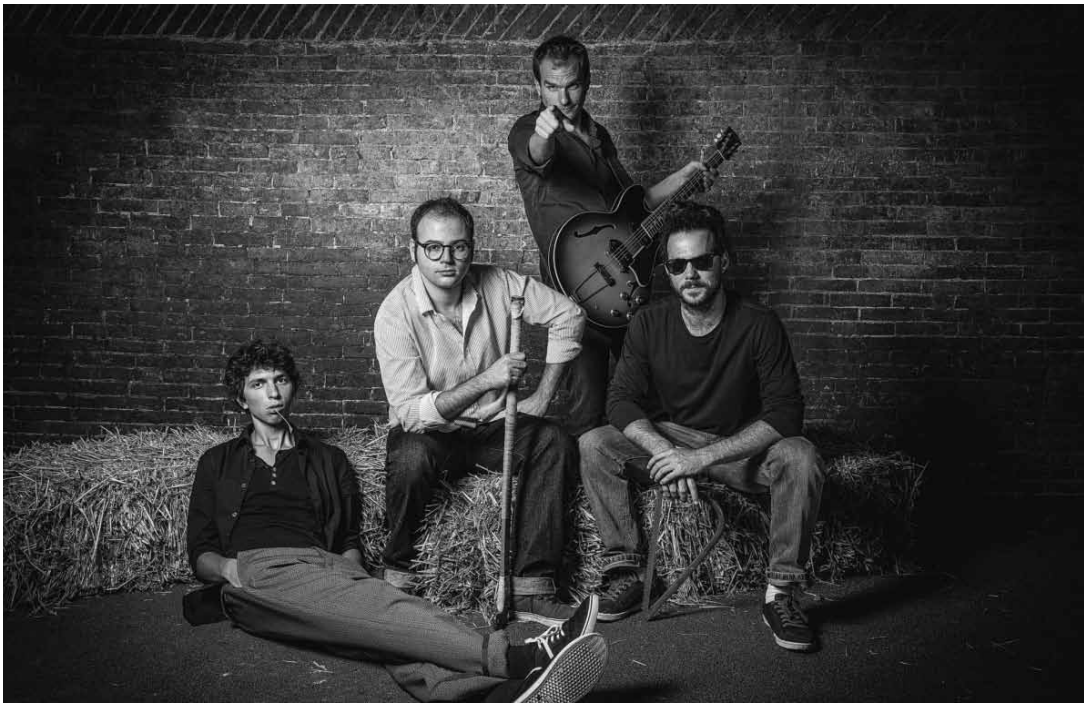
Les musiciens de Kuhn Fu ne sont pas là pour jouer... gentiment.