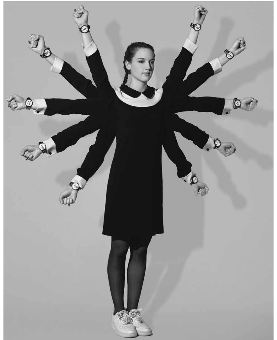
Jain, mettra la main à la pâte ce vendredi 2 juin à la Rockhal.