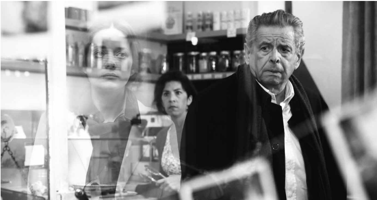
Les spectres du passé sont légion dans le nouveau Desplechin.