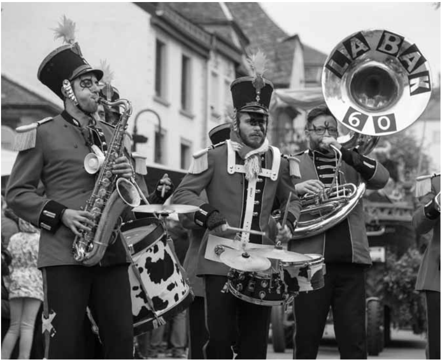
A séier erop an d'Éislek! Vum 2. bis den 5. Juni ass d'Geenzefest zu Woltz.

Bunbury (Ernst ist das Leben), Komödie von Oscar Wilde, Theater, Trier (D), 19h30. Tel. 0049 651 7 18 18 18.