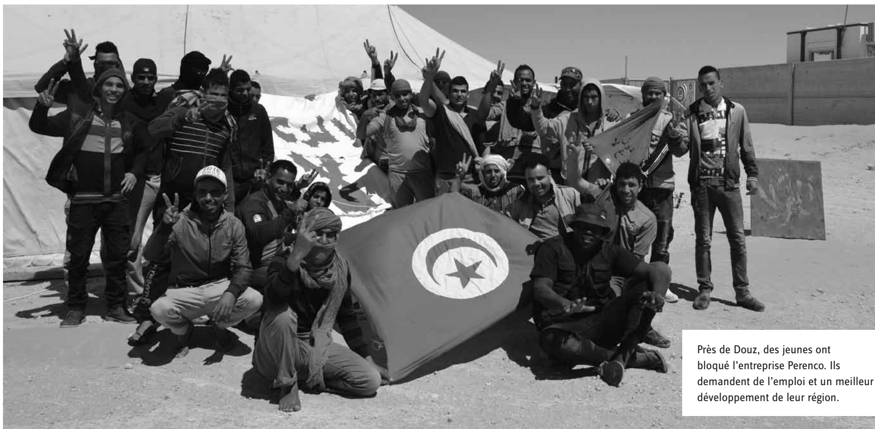
Près de Douz, des jeunes ont bloqué l'entreprise Perenco. Ils demandent de l'emploi et un meilleur développement de leur région.