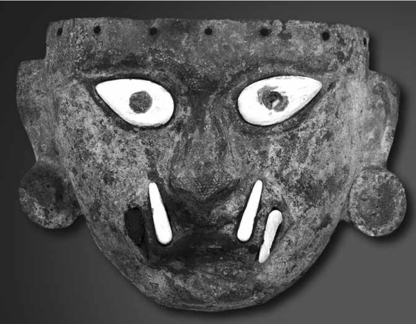
Außer dem Gold haben die Kolonialherren auch nicht viel von ihnen übrig gelassen: „Inka: Gold. Macht. Gott.“ - in der Völklinger Hütte bis zum 26. November.

Saarart 11 kollektive Ausstellung von acht KünstlerInnen, Saarländisches Künstlerhaus (Karlstraße 1, Tel. 0049 681 37 24 85), bis zum 18.6., Di. - So. 10h - 18h.