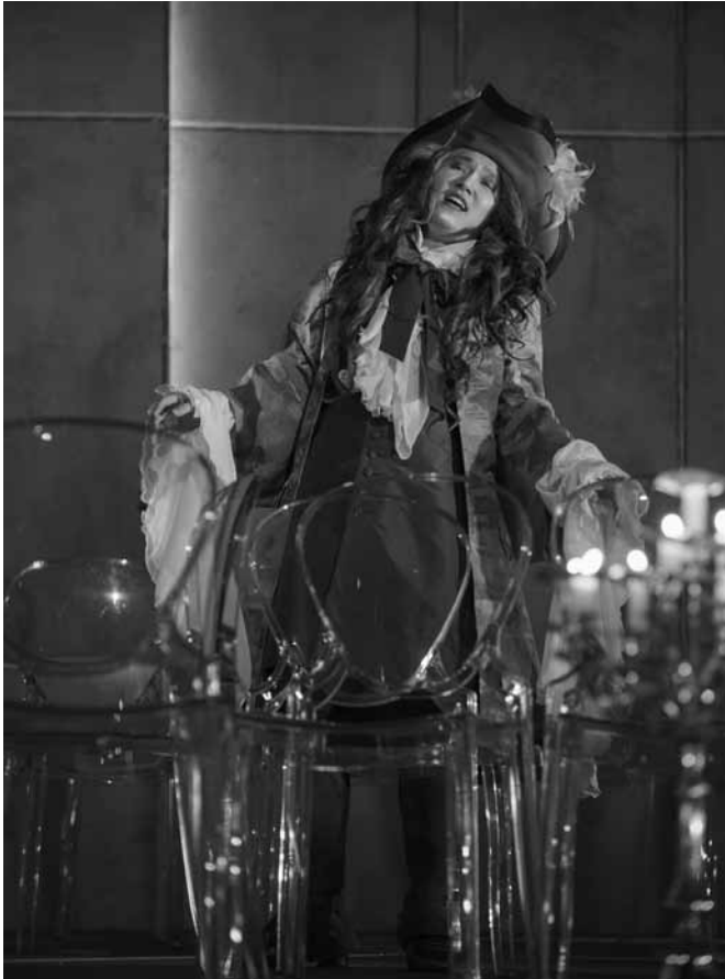
Baroque de bout en bout ?