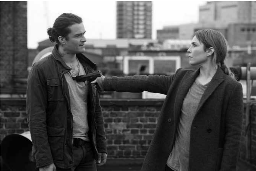
Vielleicht nicht der beste Zeitpunkt um einen Action-Thriller über Terror in Großbritannien herauszubringen: „Unlocked“ - neu im Kinepolis Kirchberg.

Tony Webster ist ein scheinbar normaler Mann. Geschieden und im Ruhestand lebt er ein relativ unspektakuläres Leben. Doch eines Tages holt ihn der Schatten seiner Vergangenheit ein und er steht plötzlich vor einem mysteriösen Erbe: Ein Tagebuch, geführt von Tonys ehemaligem besten Freund. Je tiefer er in seiner Vergangenheit gräbt, desto mehr beginnt Tony, sein bisheriges Leben zu hinterfragen.