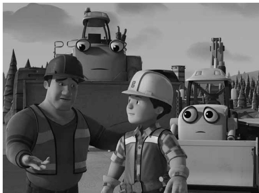
Die Baustellen in der Stadt kann man seinen Kindern nun wenigstens pädagogisch etwas näher bringen: „Bob The Builder“ - neu im Kinopolis Kirchberg und Belval.

Bob der Baumeister und seine treuen Helfer Baggi, Buddel und Heppo haben einen neuen, riesengroßen Auftrag: Ein alter, leerstehender Steinbruch