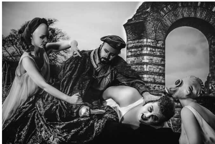
Mozarts Operndrama um den kretischen König Idomeneo, der seinen Sohn dem Meeresgott Poseidon opfern soll, am 10., 20., 23., 25. Juni und am 2., 6. und 9. Juli im Theater Trier.

Annika & the Forrest, café Konrad, Luxembourg , 21h.