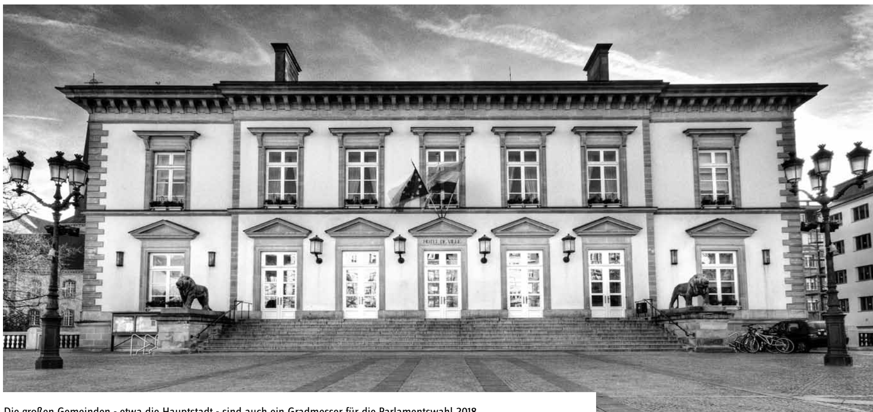
Die großen Gemeinden - etwa die Hauptstadt - sind auch ein Gradmesser für die Parlamentswahl 2018.

ist hier wohl nur das bekannteste Beispiel. Ob erfahrener LokalpolitikerIn oder aufstrebender Neuling, der Posten des/der SpitzenkandidatIn ist daher in der Regel hart umkämpft.