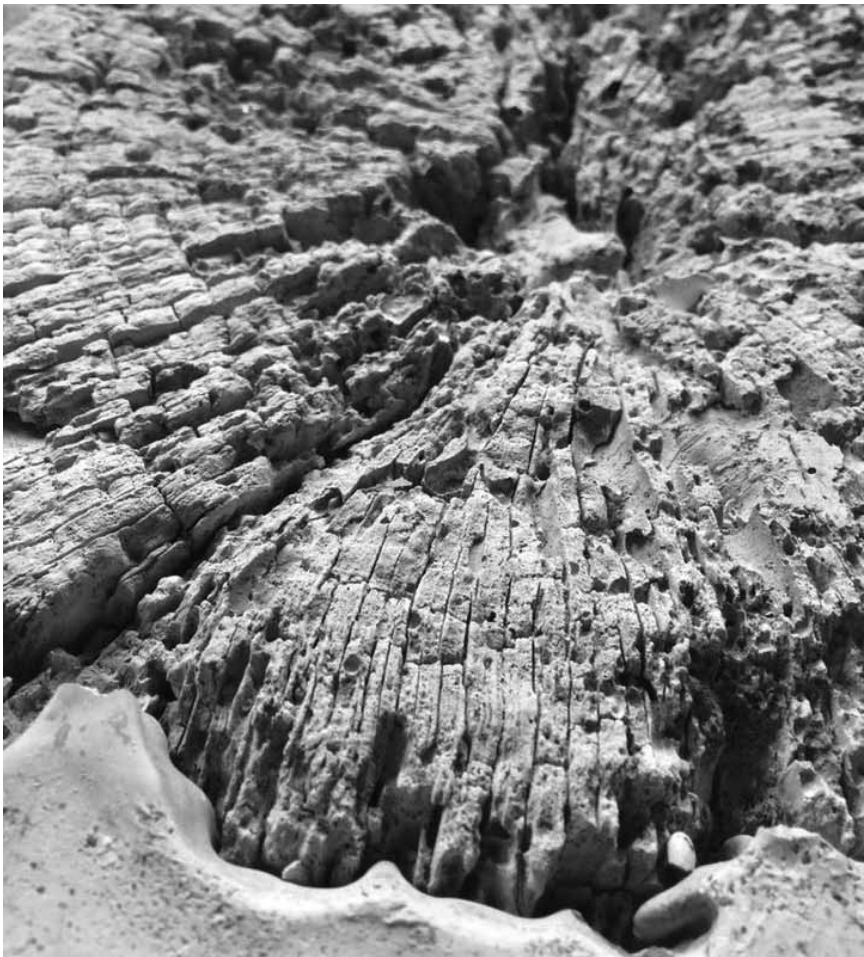
Quitte à pourrir, autant le faire en toute beauté : « Beautiful Decay », exposition collective à Bettembourg dans une galerie éphémère (62, rue d'Abweiler) jusqu'au 16 juillet.

Musée national de la Résistance (place de la Résistance, tél. 54 84 72), Esch-sur-Alzette, ma. - di. 14h - 18h. Musée national d'histoire naturelle (25, rue Münster, tél. 46 22 33-1), Luxembourg, me. - di. 10h - 18h, ma nocturne jusqu'à 20h. Musée national d'histoire et d'art (Marché-aux-Poissons, tél. 47 93 30-1), Luxembourg, ma., me., ve. - di. 10h - 18h, je. nocturne jusqu'à 20h. Fermé le 23.6. Lëtzebuerg City Museum (14, rue du St-Esprit, tél. 47 96 45 00), Luxembourg, ma., me., ve. - di. 10h - 18h, je. nocturne jusqu'à 20h. Nouvelle exposition permanente « The Luxembourg Story : plus de 1.000 ans d'histoire urbaine ». Musée d'art moderne Grand-Duc Jean (parc Dräi Eechelen, tél. 45 37 85-1), Luxembourg, je. - lu. 10h - 18h, me. nocturne jusqu'à 23h (galeries 22h). Musée Dräi Eechelen (parc Dräi Eechelen, tél. 26 43 35), Luxembourg, ma., je. - di. 10h - 18h, me. nocturne jusqu'à 20h. Fermé le 23.6. Villa Vauban - Musée d'art de la Ville de Luxembourg (18, av. Emile Reuter, tél. 47 96 49 00), Luxembourg, lu., me., je., sa. + di. 10h - 18h, ve. nocturne jusqu'à 21h. The Bitter Years (château d'eau, 1b, rue du Centenaire, tél. 52 24 24-303), Dudelange, me., ve. - di. 12h - 18h, je. nocturne jusqu'à 22h. The Family of Man (montée du Château, tél. 92 96 57), Clervaux, me. - di. + jours fériés 12h - 18h.