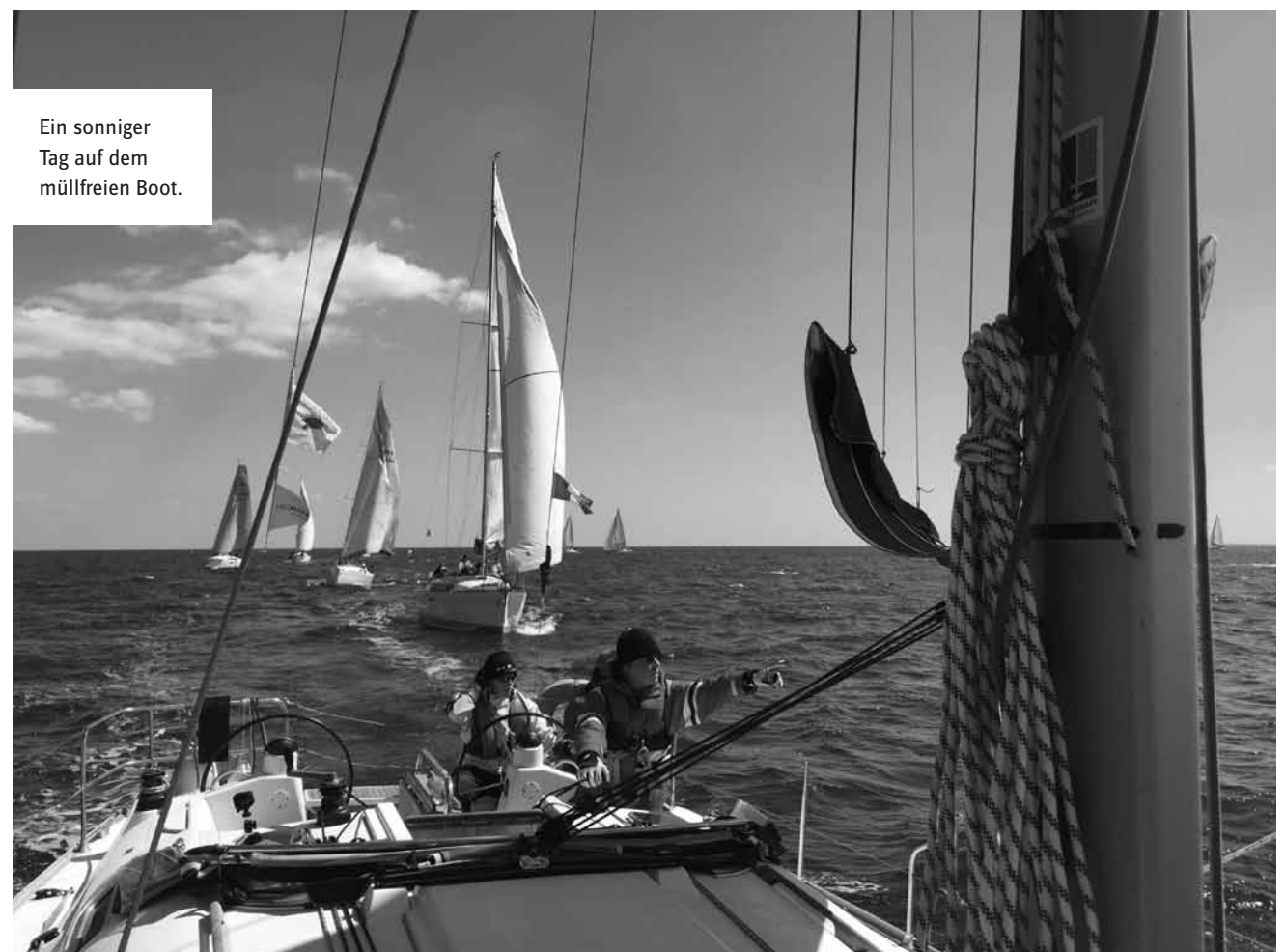
Ein sonniger Tag auf dem müllfreien Boot.

auf engstem Raum zusammenleben. Der größte Anteil wird ganz klassisch entsorgt: Auf dem Schiff werden Essensreste und sonstiger Müll in einem Eimer gesammelt. Wenn der voll ist und man abends im Hafen anlegt, nimmt einer der Crew den Müllbeutel mit und entsorgt ihn in dem dafür vorgesehenen Container. Hat man