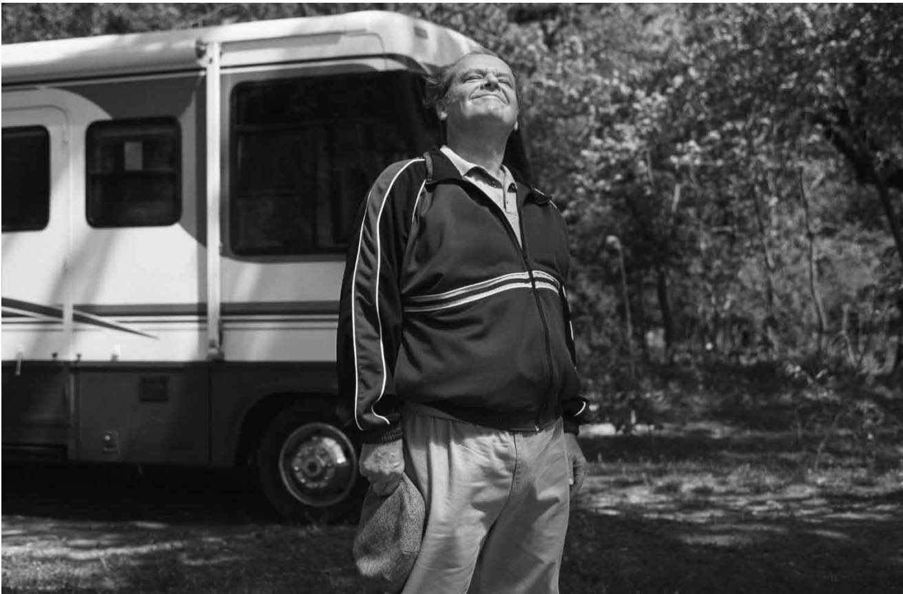
« About Schmidt », un des rares rôles où Jack Nicholson ne joue ni le méchant, ni le psychopathe, mais un homme seul qui doit se réinventer - samedi 24 juin à la Cinémathèque.

On a deux tueurs, dont l'un cite la Bible avant de finir son travail, l'amie de leur chef qui devrait y aller plus doucement avec la drogue, un boxeur en fuite parce qu'il a gagné un match qu'il avait promis de perdre. ❖❖ La narration non linéaire est toujours très jouissive, mais le style de