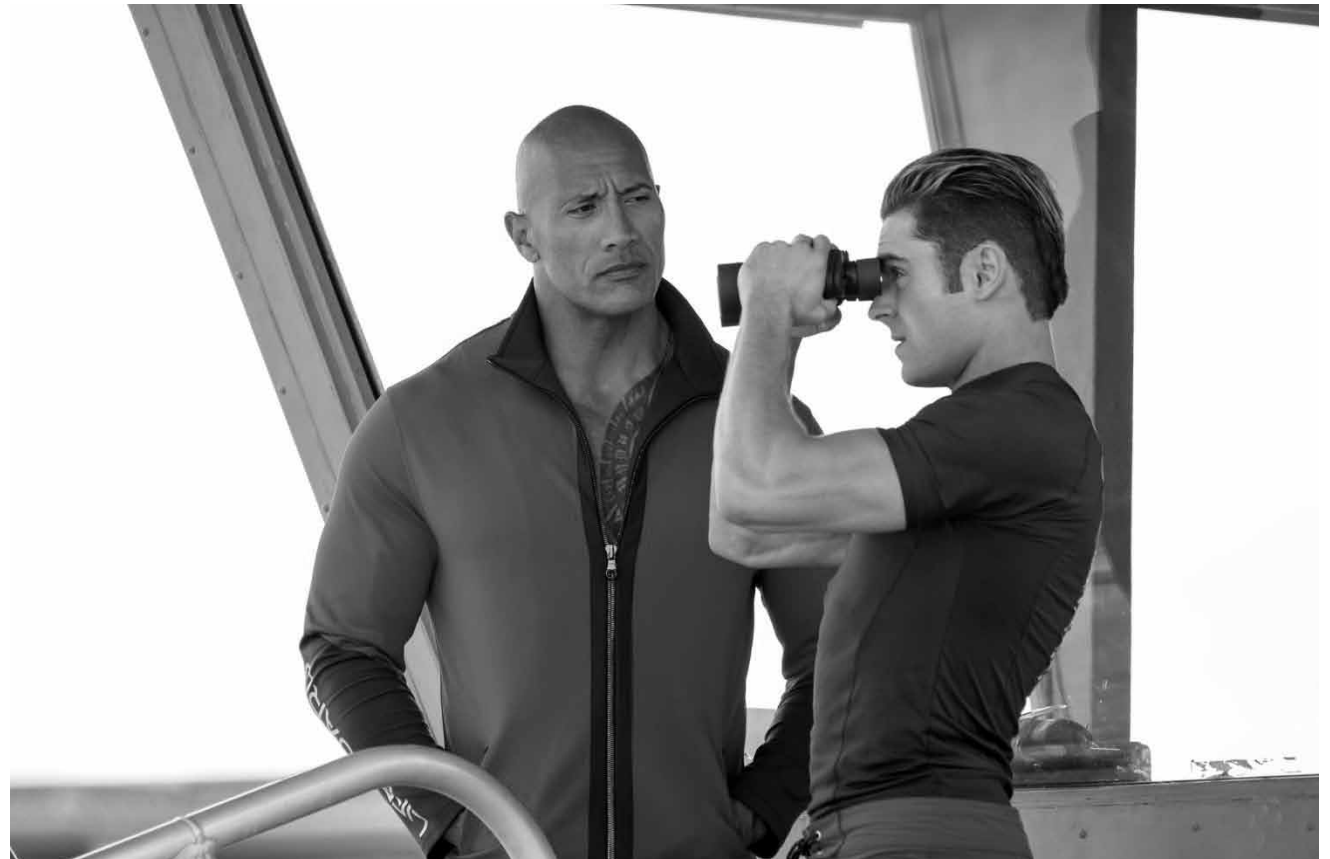
Auch ohne Hasselhoff eine Lachnummer: „Baywatch“ - neu in den meisten Sälen.

Couple mixte, Chris et sa petite amie Rose filent le parfait amour. Le moment est donc venu de rencontrer les beaux parents, Missy et Dean, lors d'un week-end sur leur domaine dans le nord de l'État. Chris commence par penser que l'atmosphère tendue est liée à leur différence de couleur de peau, mais très vite une série d'incidents de plus en plus inquiétants lui permet de découvrir l'inimaginable.