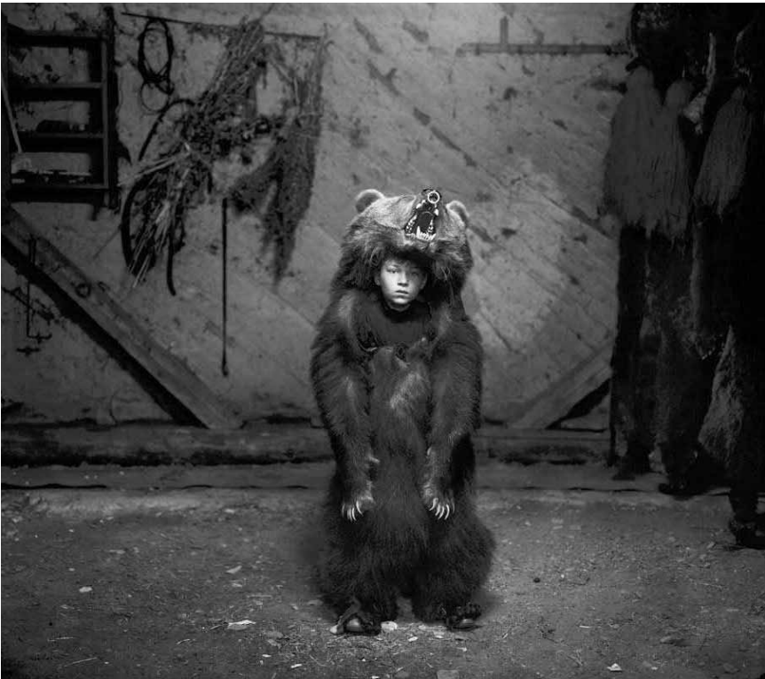
Pour Tamas Deszo, la fin est toujours proche : « Notes for an Epilogue », au Schlassgaart de Clervaux jusqu'au 30 mars 2018.

The Family of Man (montée du Château, tél. 92 96 57), Clervaux, me. - di. + jours fériés 12h - 18h.