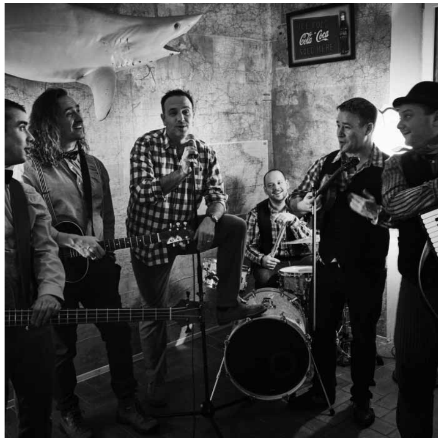
Folk aus Luxemburg der manche zum Träumen bringt: Dream Catcher spielen am 30. Juni im K Restaurant in Huldange.