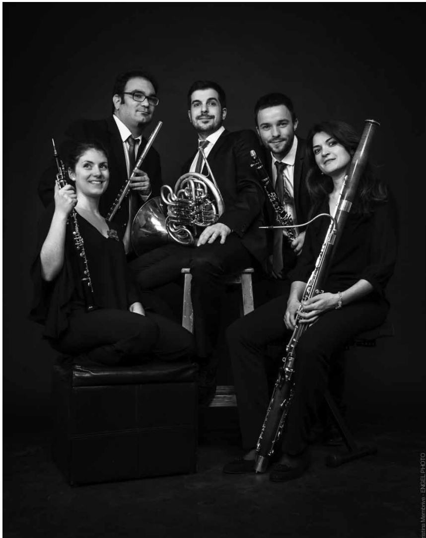
Mozart, Onslow, Turina, Magrané und Nielsen stehen auf dem Programm, welches das Azahar Ensemble sich für ihr Konzert am 9. Juli in der Alten Abtei in Mettlach ausgedacht hat.