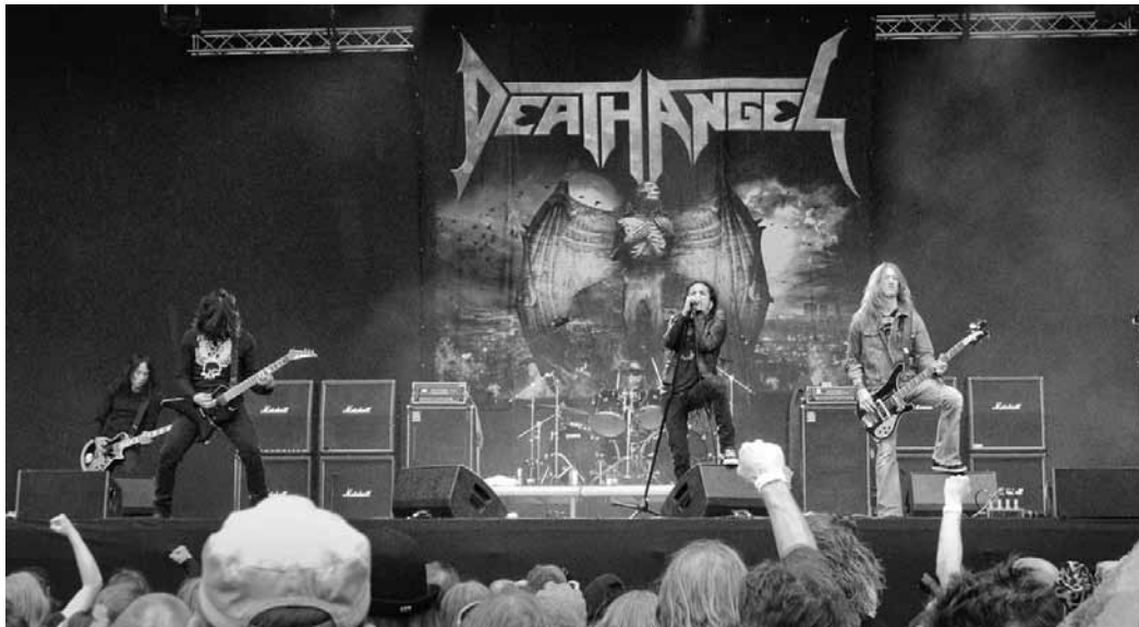
Vieux, mais pas ringards : Angel Death.