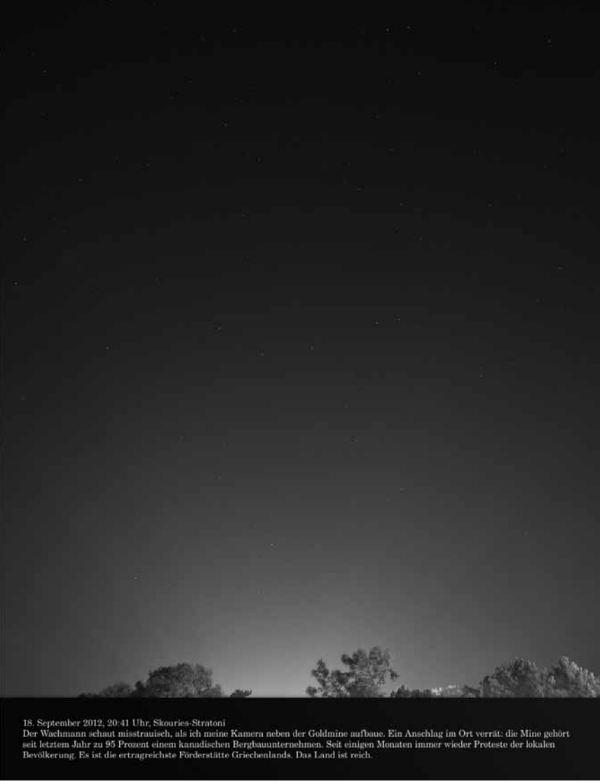
18. September 2012, 20:41 Uhr, Skouries-Stratoni Der Wachmann schaut misstrauisch, als ich meine Kamera neben der Goldmine aufbaue. Ein Anschlag im Ort verrät: die Mine gehört seit letztem Jahr zu 95 Prozent einem künftlichen Bergbauunternehmen. Seit einigen Monaten immer wieder Proteste der lokalen Bevölkerung. Es ist die ertragreichste Förderstätte Griechenlands. Das Land ist reich.

Pour une fois que la Villa Vauban se met au contemporain, elle vise juste. Les photographies de l'artiste allemand Sven Johne mêlent reportage, humour et surréalisme : « Greece Series », jusqu'au 10 septembre.