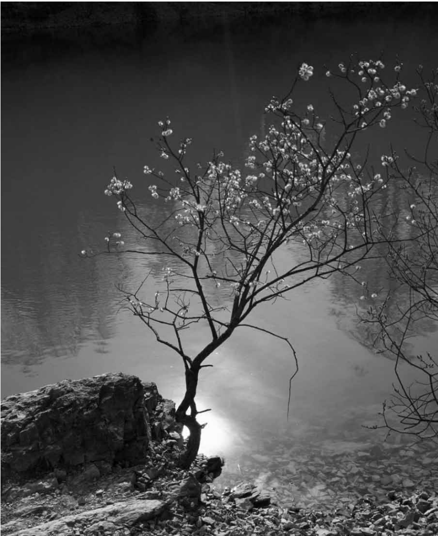
Il a des histoires à raconter : « Narratives », de Sascha Weidner - au Schlassgaart de Clervaux jusqu'au 30 mars 2018.

(montée du Château, tél. 92 96 57), Clervaux, me. - di. + jours fériés 12h - 18h.