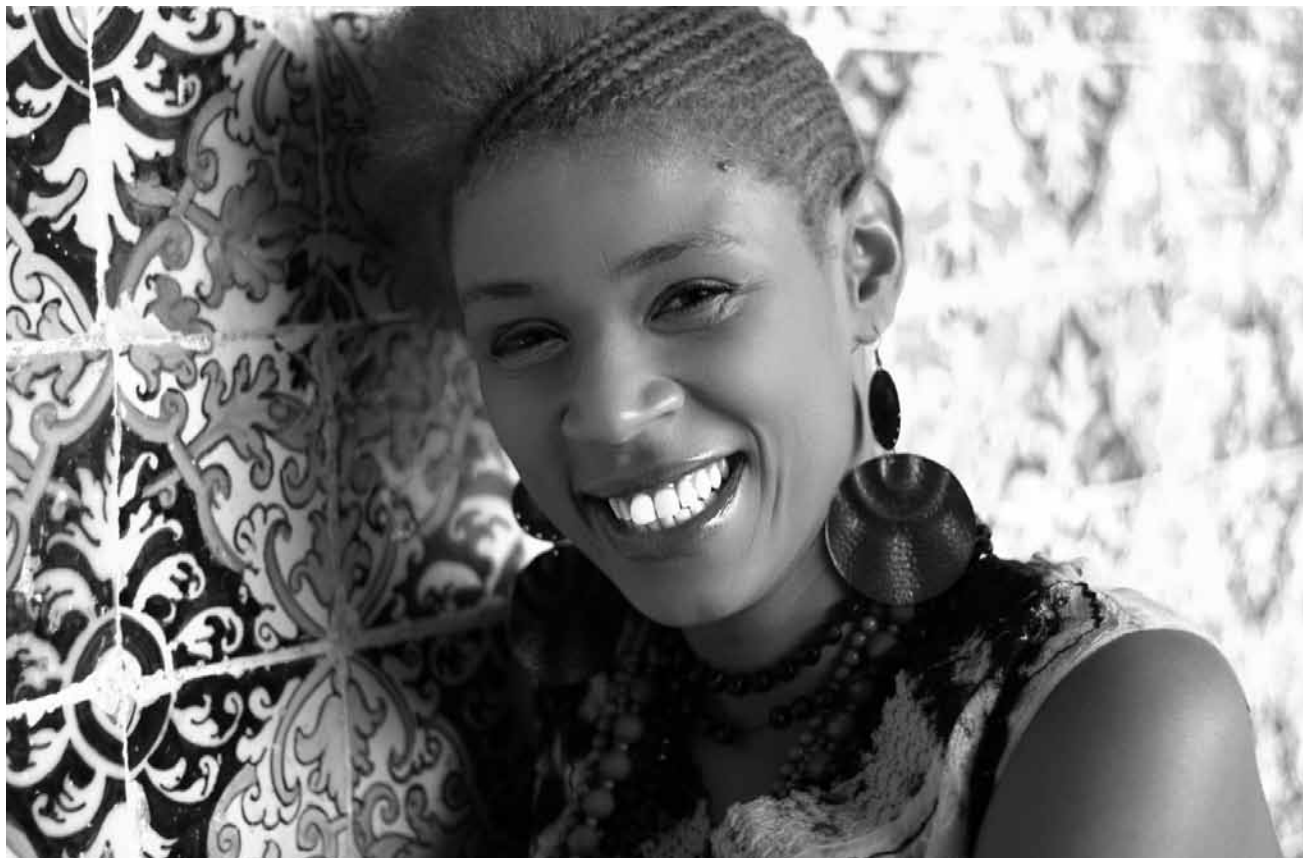
La chanteuse capverdienne Carmen Souza se produira dans la cour de l'abbaye d'Echternach le 12 juillet - dans le cadre du festival international.

Beth Hart , blues rock and jazz, Den Atelier, Luxembourg , 20h. www.atelier.lu