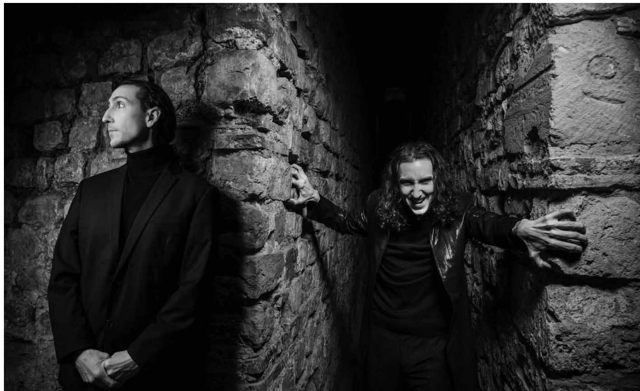
Sie kehren zurück: „Jekyll & Hyde Resurrection“ - Rockmusical von Frank Wildhorn, am 7., 8., 11., 12., 13., 14. + 15. Juli im Theater Trier.

Arcade Fire , indie rock, Den Atelier, Luxembourg , 19h. www.atelier.lu Voir article p. 4