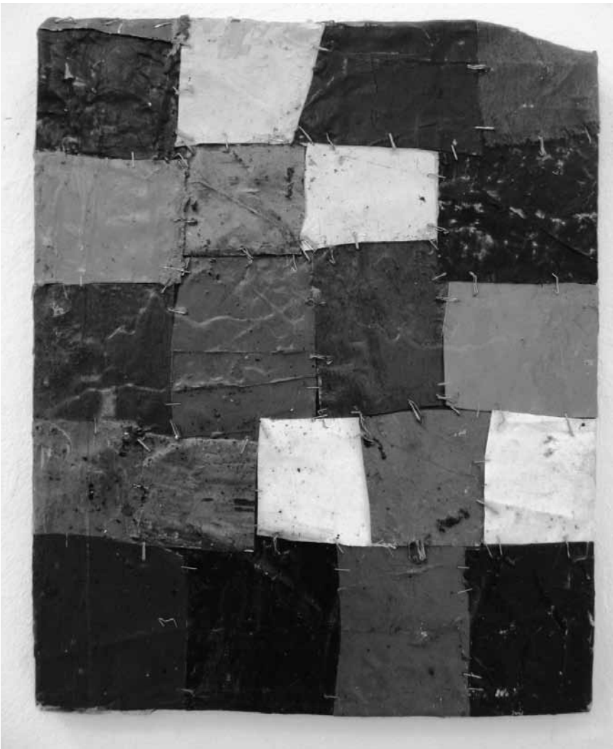
Frank Gerlitzki marque ses « Territories » à la galerie d'art municipale de Diekirch, encore jusqu'au 30 septembre.

(montée du Château. Tél. 92 96 57), Clervaux, me. - di. + jours fériés 12h - 18h.