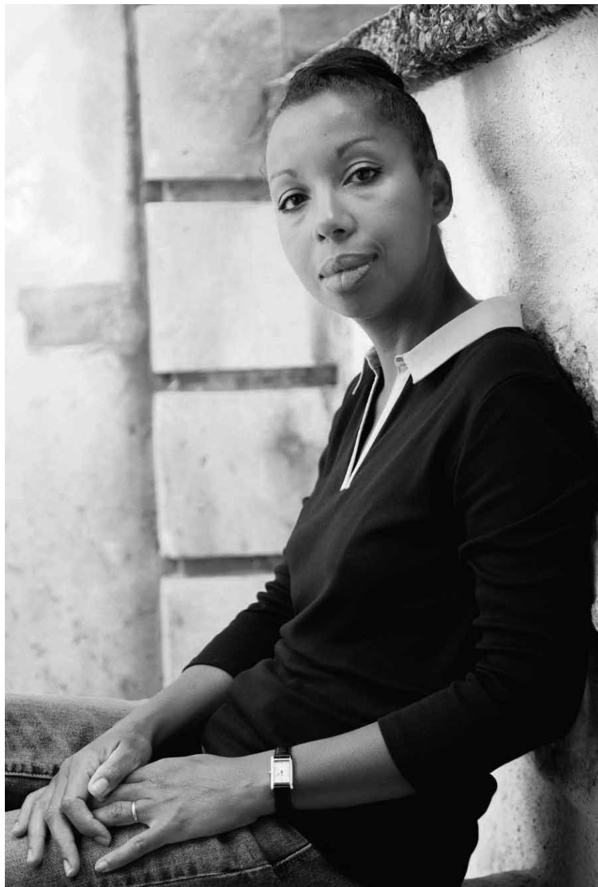
Elle viendra à Neimënster le 19 septembre : l'écrivaine française Marie NDiaye discutera avec le public après la lecture scénique de son texte « Délivrance ».