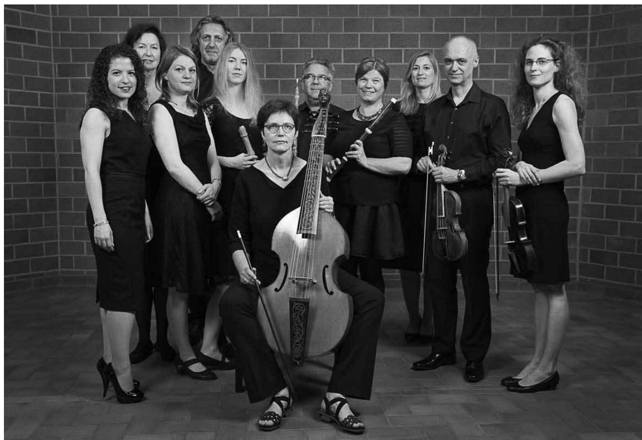
Jusqu'à ce que vos oreilles soient satisfaites : l'ensemble Ad libitum rendra hommage à Telemann, le 23 septembre au Kongschtmillen de Pétange et le 24 à l'église de Lorentzweiler.

Nuit des lampions , pl. des Martyrs, Gruberbeerig et jardin de Wiltz, Wiltz , 16h. www.ndl.lu Org. Coopérations.