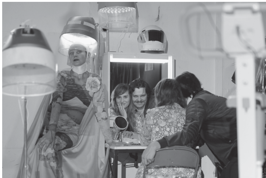
Klingt zwar nach Schlagerabend, ist aber feinstes dystopisches Kabarett: „Der Große Preis - Songs für Europa“ - am 22. und am 28. September in der sparte4 in Saarbrücken.

Voyage dans les mers inconnues - une caravelle pleine de surprise , atelier pour enfants de six à douze ans, Musée national d'histoire et d'art,