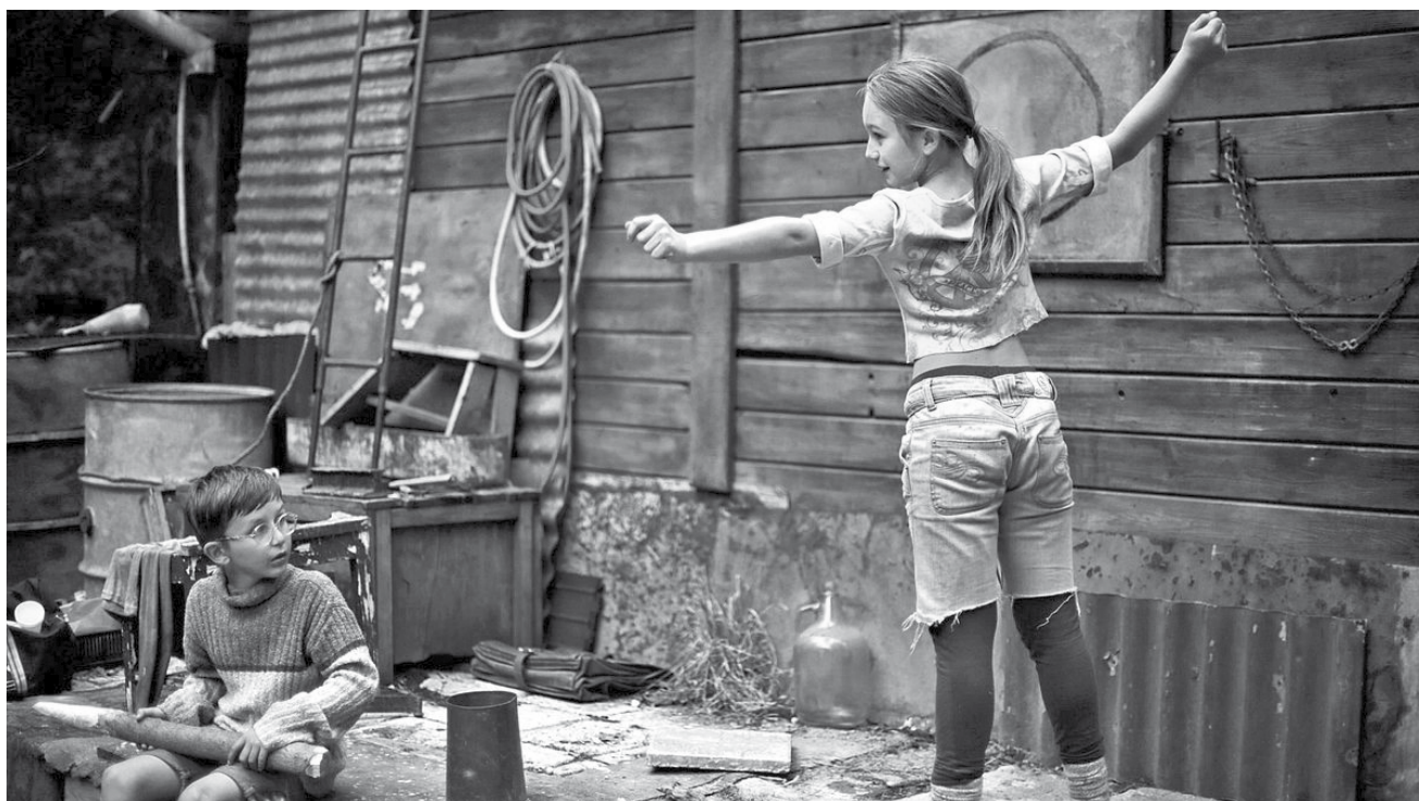
The heart-breaking story of Jarka - a little girl living with an estranged family that shelters two twin babies - is at the center of "Piata Lod" (Little Harbour - Sunday at the Cinémathèque.

Franco Nero et Jeanne Moreau. 108'. V.o. + s.-t. fr. & ang.