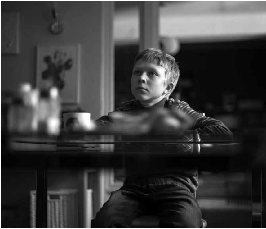
Le petit Aliocha, personnage central et pourtant absent pendant presque tout le film.