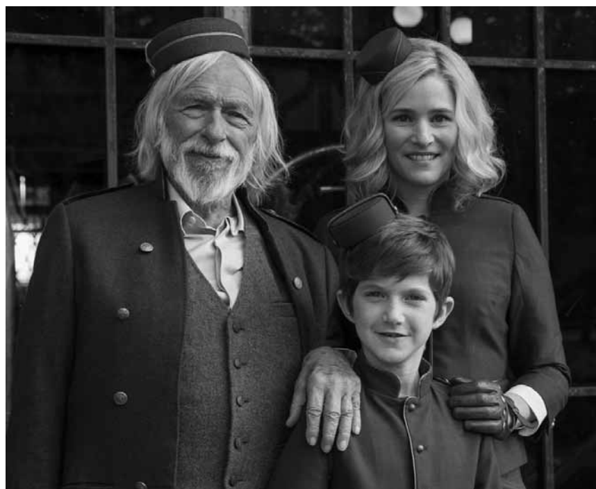
Encore une bédé classique adaptée sur grand écran : « Le Petit Spirou » - nouveau aux Kinepolis Belval et Kirchberg.

Nachwuchsspion Gary „Eggsy“ Unwin und sein Kollege Merlin werden mit einer neuen Gefahr konfrontiert: Die skrupellose Poppy