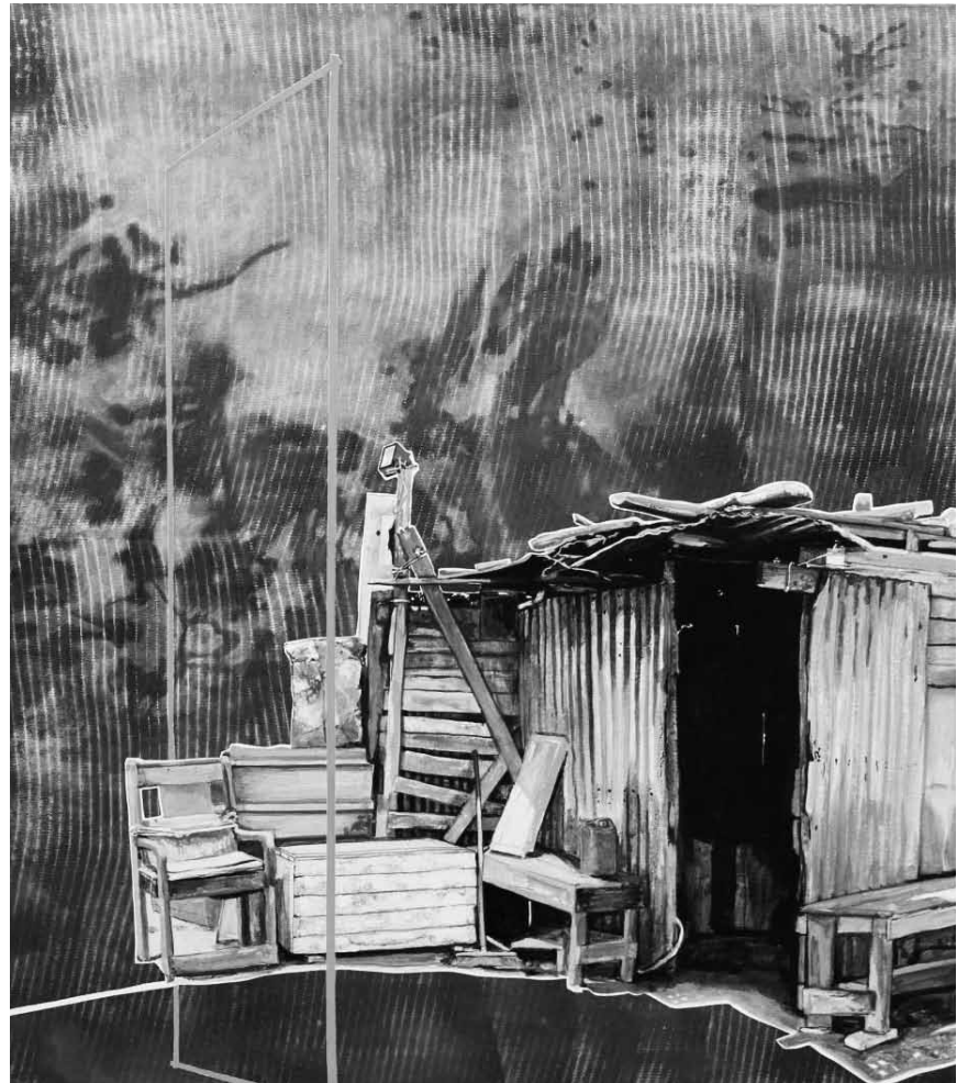
Mit Romain Van Wissen stellt einer der gefragtesten Künstler Ostbelgiens im Ikob in Eupen aus - noch bis zum 19. November.