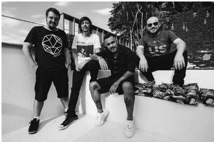
La samba électrique et éclectique de Marcelo D2 & Sambadrive chauffera la Kulturfabrik d'Esch le 19 octobre.

19h30. Tél. 0049 651 7 18 18 18. www.theatertrier.de