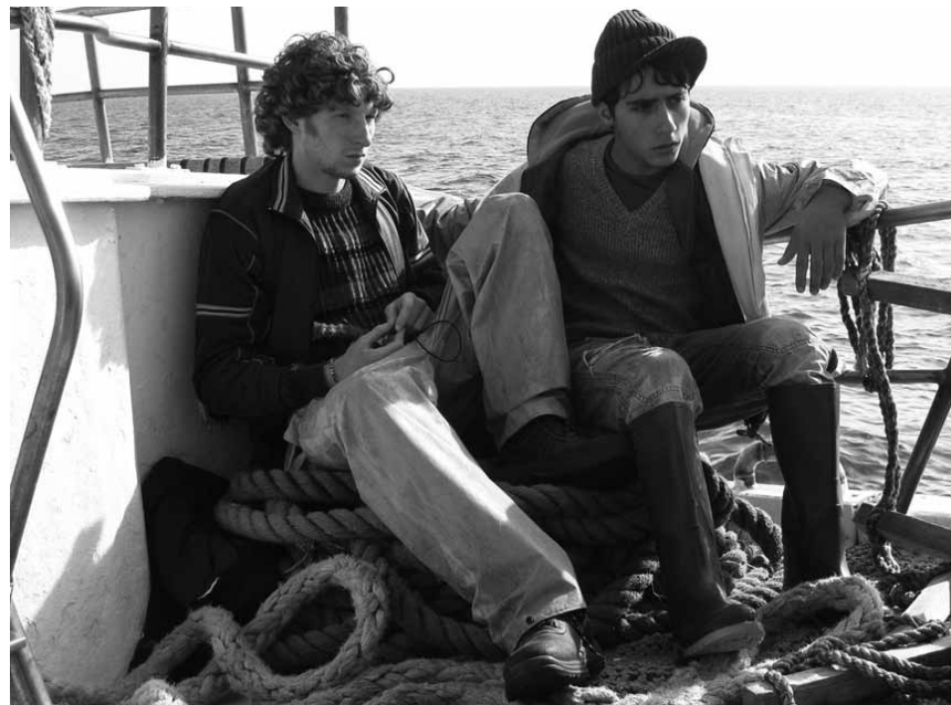
Der Untergang einer sizilianischen Fischerfamilie im wörtlichen und im übertragenen Sinn: „Malavoglia“ - am 6. November in der Cinémathèque.

Jimmy und Tommy können machen, was sie wollen. Sie sind Mitglieder der New Yorker Quartier-Mafia, brauchen auf niemanden Rücksicht zu nehmen und verdienen eine Menge Geld. Henry Hill ist von diesem Leben fasziniert und arbeitet daran, es ebenfalls führen zu können. Er wird in