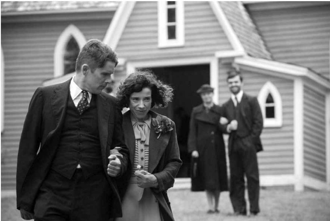
Un mariage heureux après tout.