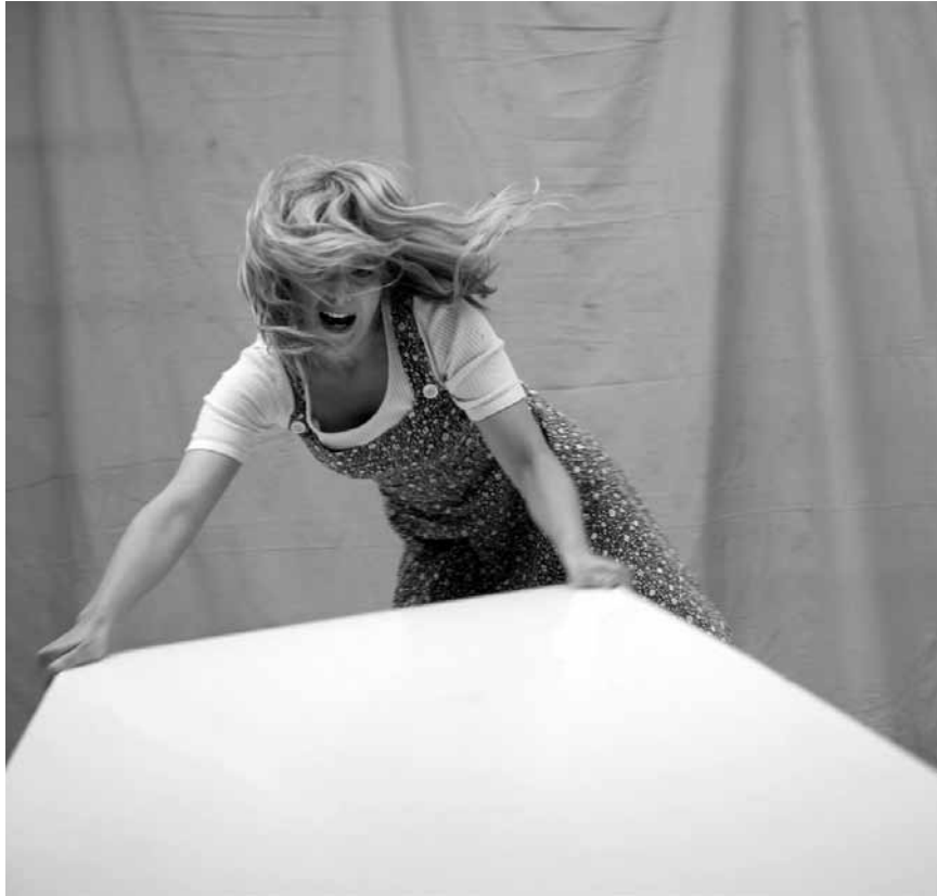
Le combat d'une jeune actrice provinciale contre le chauvinisme culturel parigot et le chauvinisme tout court : « Maryline » - nouveau à l'Utopia.