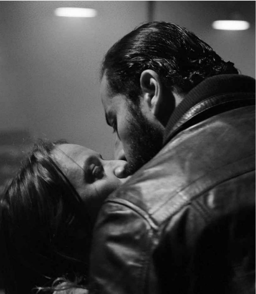
Avec « M », projeté à l'Utopia dans le cadre du cycle Out of the Box, l'actrice Sara Forestier signe un premier long métrage personnel et engagé sur la différence et l'analphabétisme.

1973 befindet sich die Profi-Tennispielerin Billie Jean King als Weltranglistenerste auf dem vorläufigen Höhepunkt ihrer Karriere. Doch die vielen Turniersiege und der Ruhm sind nicht alles für sie, denn King setzt sich außerdem mit Vehemenz für die Gleichberechtigung von Frauen ein. Bobby Riggs hingegen hat seine besten Jahre schon lange hinter sich. Um den Ruhm alter Tage wieder aufleben lassen ist er jedoch bereit, seine ganze Reputation aufs Spiel zu setzen. In der Öffentlichkeit vertritt er bezüglich der Geschlechterdebatte die entgegengesetzte Meinung zu der von King und so kommt es zum unvermeidlichen Zusammenprall in einem Tennismatch der Geschlechter, das als „Battle Of The Sexes“ in die Geschichte eingehen soll.