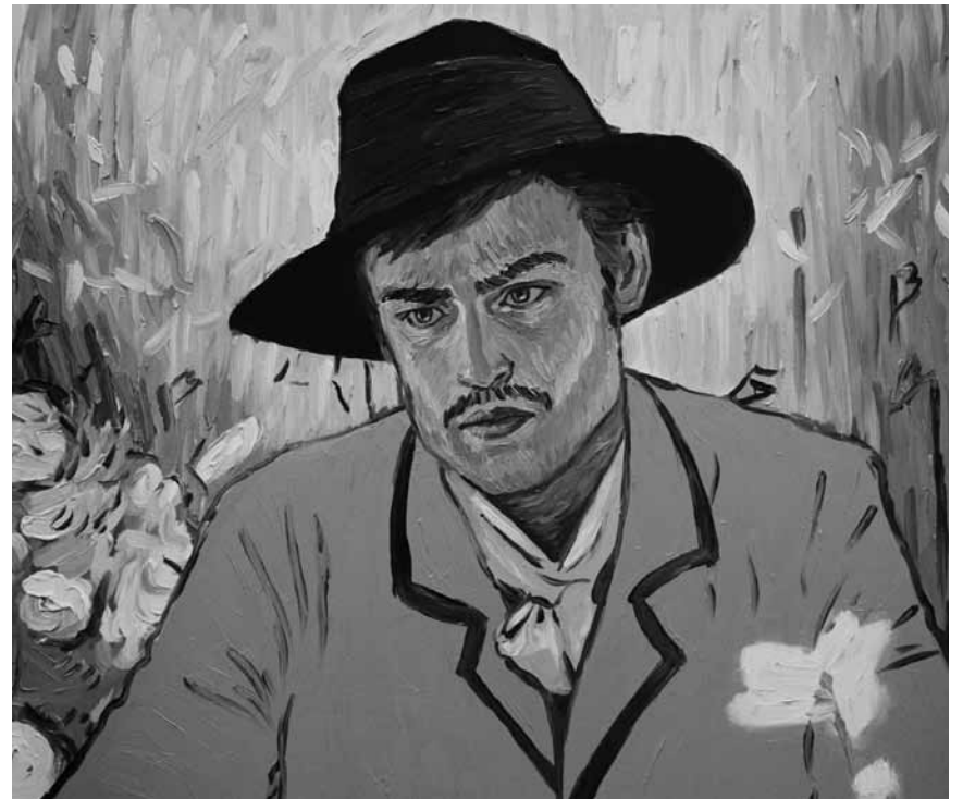
Ein ganzer Film als Ölgemälde ... besser hätte man Van Gogh nicht huldigen können - „Loving Vincent“, neu im Utopia.

Im Norden Calais wohnt die gutbürgerliche Familie Laurent in ihrer eigenen Wohlstandsblase und eigenen Problemen. Familienoberhaupt George hat gerade einen Selbstmordversuch hinter sich und sitzt im Rollstuhl. Seine Tochter Anne ist mit Lawrence Bradshaw verlobt und leitet das familieneigene Bauunternehmen. Ihr Sohn Pierre sieht sich hingegen noch nicht als zukünftiger Chef. Georges Sohn Thomas hingegen ist Arzt und frischgebackener Vater mit seiner zweiten Frau Anaïs, aber untreu, was