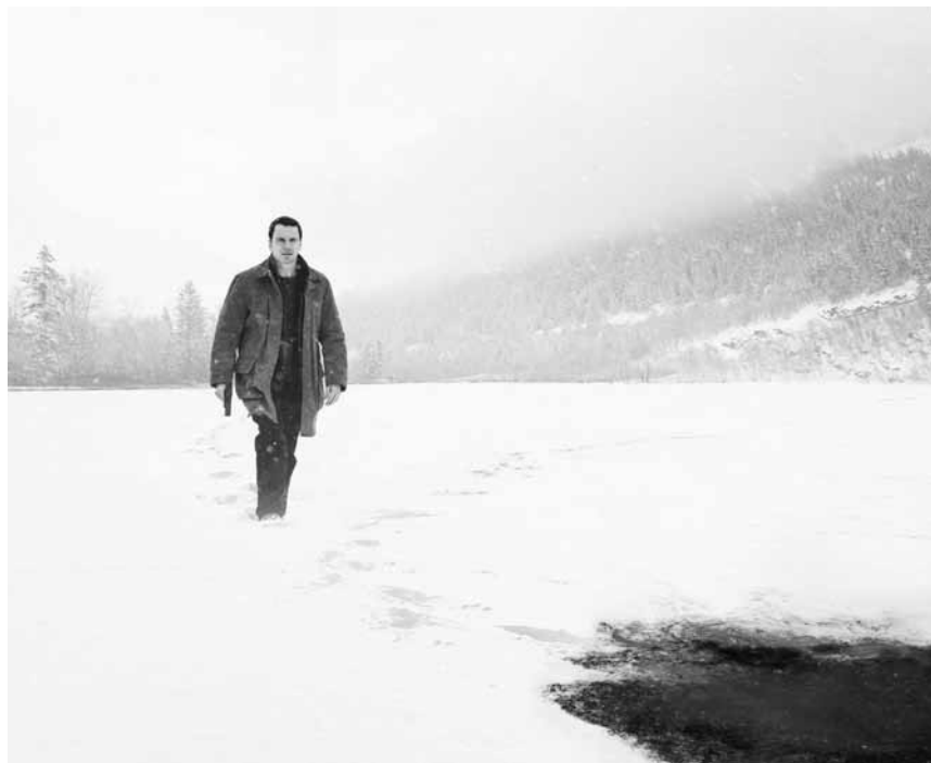
Eiskalter Thriller direkt aus der Hölle: „The Snowman“ - neu in (fast) allen Sälen.

d'Schülerstreiken ... an d'Kierch (matzen) am Duerf.