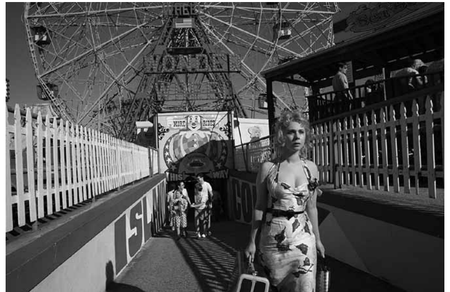
Wenn man den letzten Polemiken Glauben schenken kann, könnte dies wohl auch der letzte Woody Allen Film sein: „Wonder Wheel“, neu im Utopia.

Er trägt Schlapphut, Dufflecoat und ist ziemlich behaart: Der liebenswerte Bär Paddington hat bei Mr. und Mrs. Brown sowie deren Kindern Judy und Jonathan ein Zuhause gefunden und sich mittlerweile auch in der Nachbarschaft durch seine höfliche, zuvorkommende und immer fröhliche Art zum beliebten Mitglied gemausert. Als der 100. Geburtstag von Tante Lucy vor der Tür steht, sucht Paddington nach einem passenden Geschenk.