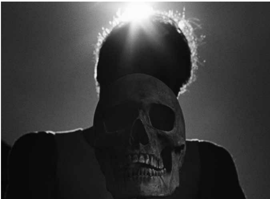
D'après le maître du polar français Jean-Patrick Manchette, « Laissez bronzer les cadavres » est un vrai régal noir de noir, mardi 6.2 à l'Utopia.