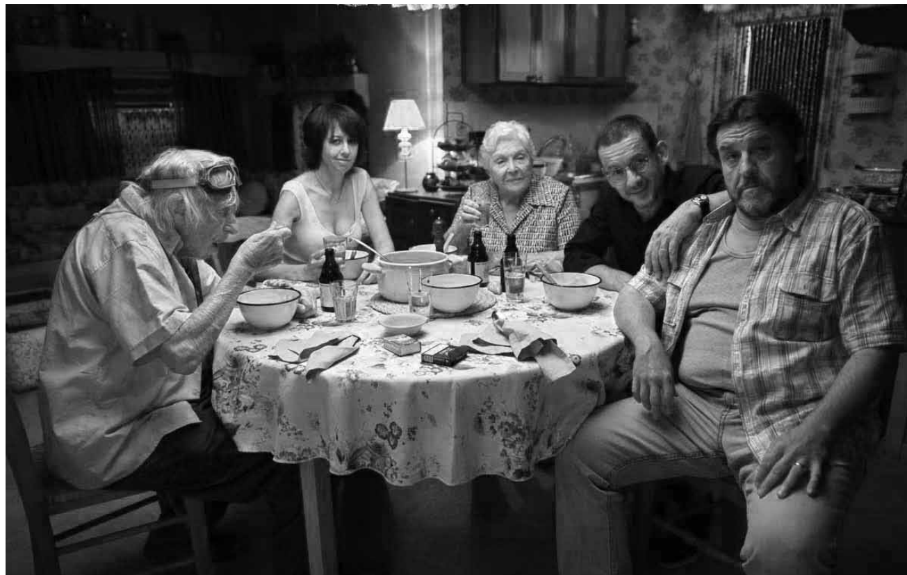
Dany Boon n'en a pas fini de nous balancer des films sur les Nordistes : « La ch'tite famille » est nouveau au Kinopolis Belval et Kirchberg.

Die Magie von Jumanji macht sich vier jugendliche Highschool-Nachsitzer zu eigen, die im Keller ihrer Schule ein Videospiel mit Rätseln, Fallen, Nashörnern und Schlangen finden. Als