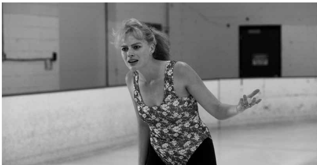
Nicht gerade eine Eiskunstlauf-Prinzessin – Tonya Harding geht es um den Sport, nicht um die Outfits.