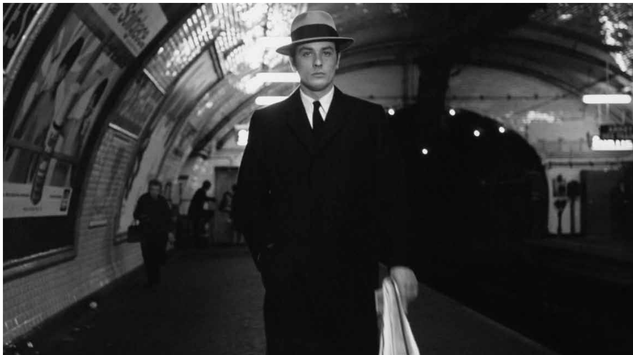
Un des meilleurs films noirs de Jean-Pierre Melville avec un Alain Delon encore potable : « Le Samouraï », vendredi 9 mars à la Cinémathèque.

In den 1950er-Jahren sind Lanny Morris und Vince Collins das heißeste Duo des Showgeschäfts und besondere Lieblinge des Gangsterkönigs Sam Marco, der mehrere Nachtclubs besitzt. Auf dem Höhepunkt ihrer Karriere angelangt, wird eines Tages die junge Maureen in der Suite der beiden Stars tot aufgefunden.