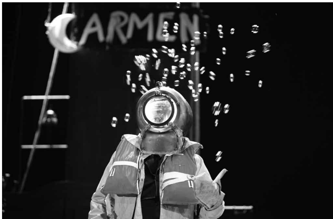
Une troupe de comédien-ne-s réinterprète l'opéra de Bizet dans un setting très breton : « Une Carmen en Turakie » - ce vendredi 2 mars aux Rotondes.

Kotzmotz, der Zauberer , Theaterstück mit Musik nach dem Kinderbuch von Brigitte Werner (> 4 Jahre), Tufa, Trier (D) , 16h. Tél. 0049 651 7 18 24 12. www.tufa-trier.de