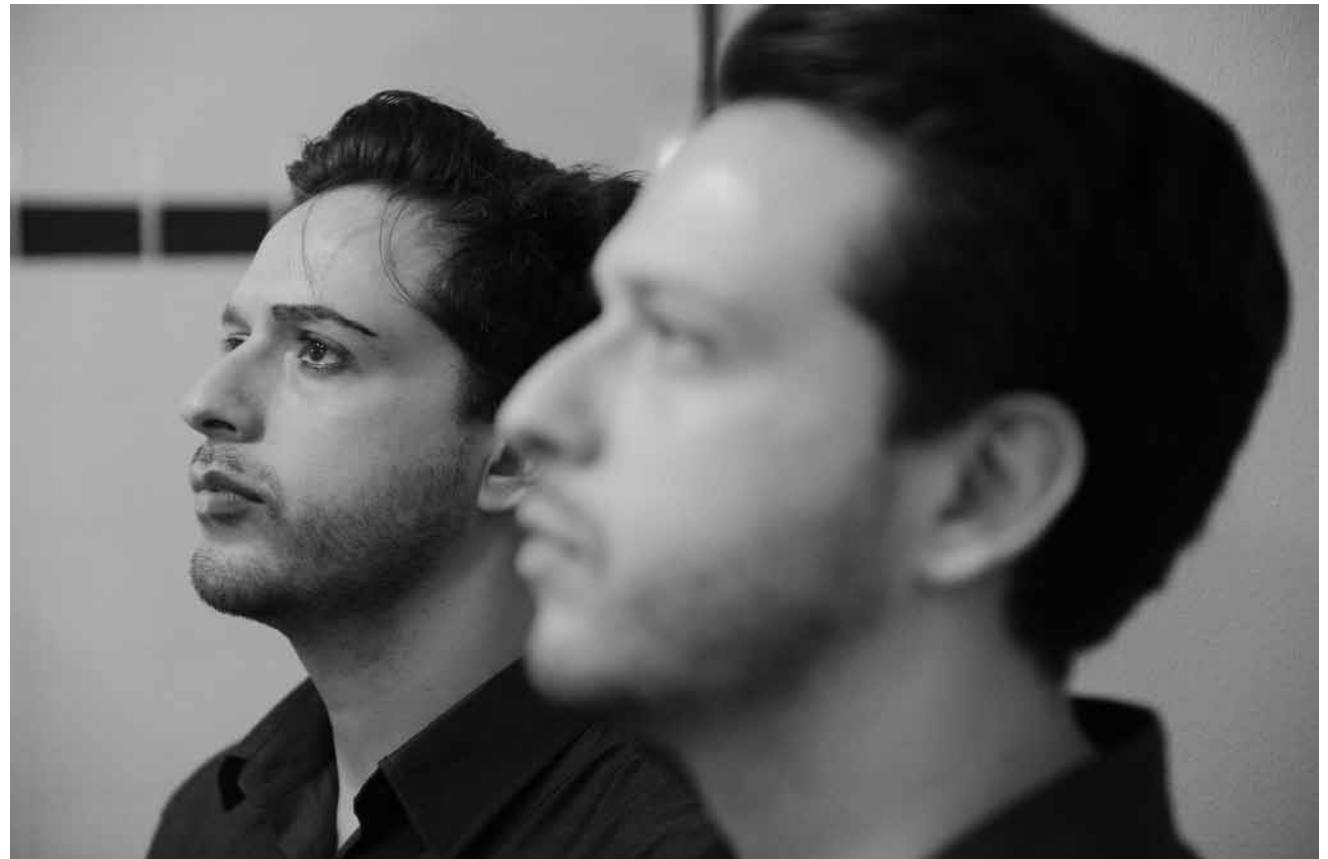
Stanislaw Lems „Solaris“ hat es schon öfter auf die Leinwand gebracht und nun auch auf die Opernbühne in einer Fassung von Michael Obst – am 8., 10. und 11. März in der Alten Feuerwache in Saarbrücken.

Café des langues, Kulturfabrik, Esch , 19h. Tél. 55 44 93-1. www.kulturfabrik.lu