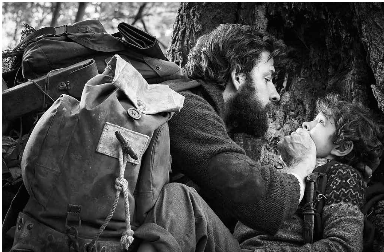
Geräuschanfällige Aliens verursachen weltweit Migränen und Chaos in „A Quiet Place“ – neu im Kinepolis Belval und Kirchberg.