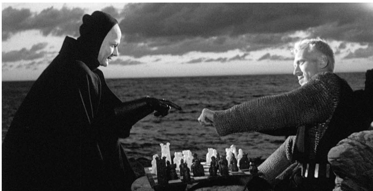
« Det sjunde inseglet », chef-d'œuvre d'Ingmar Bergman où les interrogations métaphysiques fusent dans une terrible danse macabre, est projeté le 12 juin à la Cinémathèque.