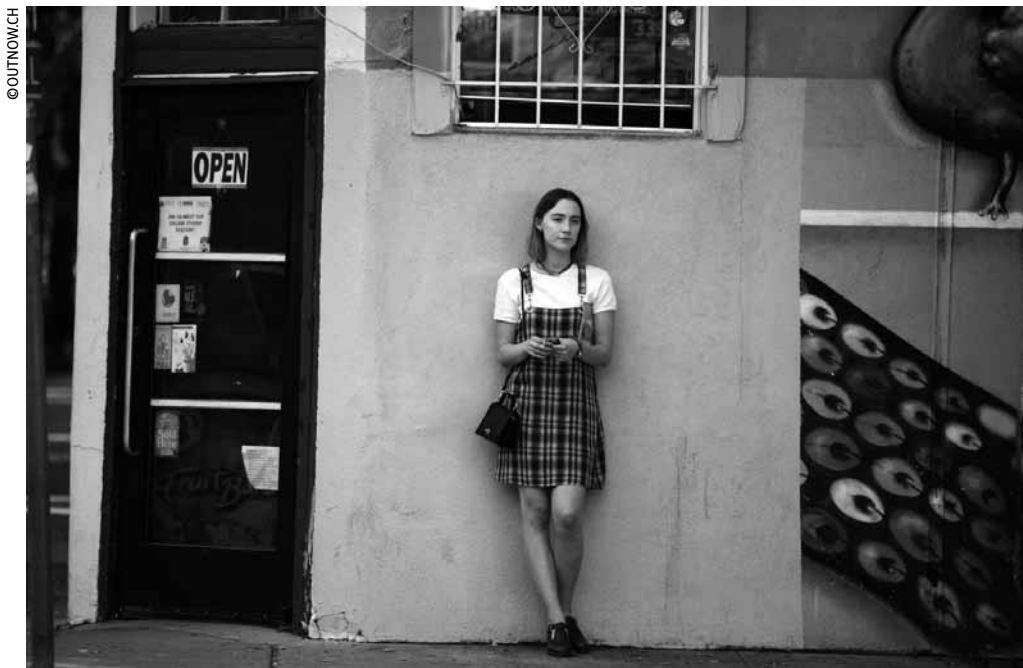
Für ihre Rolle in „Lady Bird“ erhielt die irische Schauspielerin Saoirse Ronan eine Oscarnominierung.