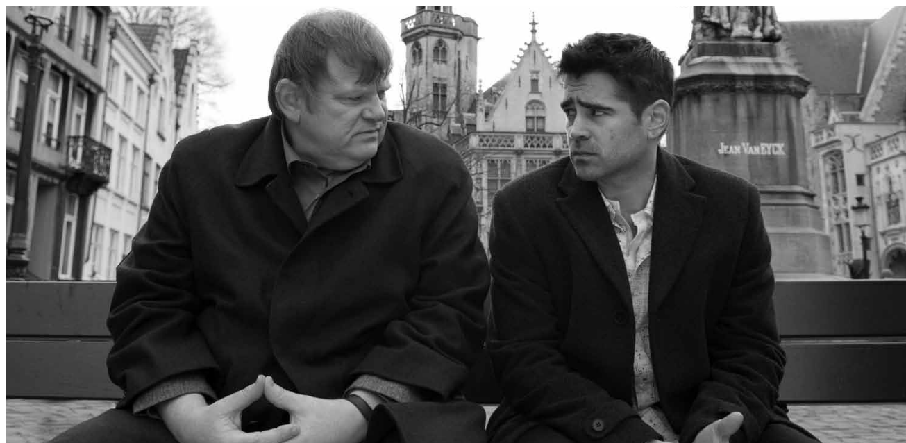
Brügge jenseits von Grachten, Schokolade und Bier: „In Bruges“ – am 27. April in der Cinémathèque.

Max Shrek will Gotham City schröpfen, um seine Gier nach Macht zu befriedigen. Als seine Sekretärin Selina Kyle seinen dunklen Machenschaften auf die Spur kommt, stößt er sie eiskalt in den Tod. Aber die verstörte Selina kommt wieder, mit einem großen Miau! Der Pinguin, der mit der Unterstützung von Max Shrek sein monströses Wesen vor den Bewohnern Gothams verbirgt, um als Bürgermeister Oswald Cobblepot gewählt zu werden, komplettiert die Riege der Schurken, denen Batman das Handwerk legen will.