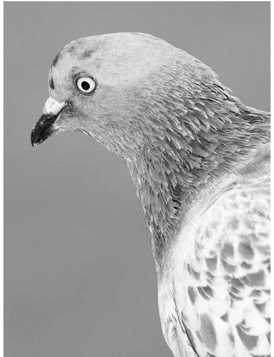
Pigeons citoyens et autres surprises vous seront servis par le photographe Mårten Lange dans son expo « Citizen » - jusqu'au 12 avril 2019 au jardin de Lélise à Clervaux.