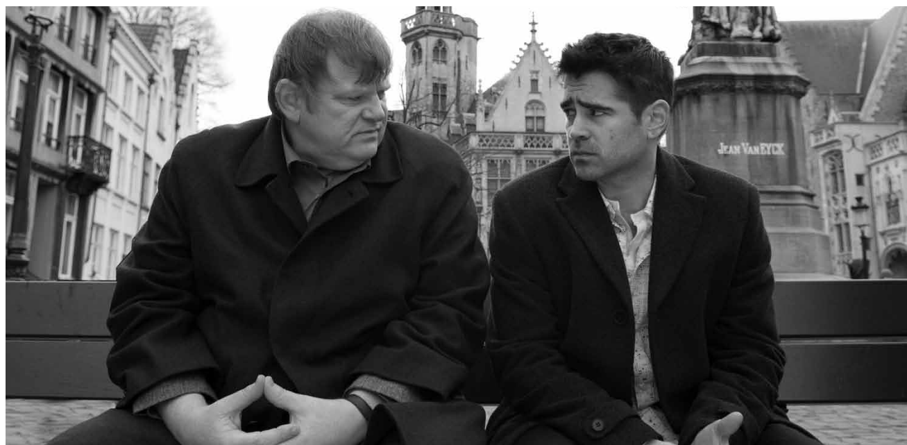
Brügge jenseits von Grachten, Schokolade und Bier: „In Bruges“ – am 27. April in der Cinémathèque.

Max Shrek will Gotham City schröpfen, um seine Gier nach Macht zu befriedigen. Als seine Sekretärin Selina Kyle seinen dunklen Machenschaften auf die Spur kommt, stößt er sie eiskalt in den Tod. Aber die verstörte Selina kommt wieder, mit einem großen Miau! Der Pinguin, der mit der Unterstützung von Max Shrek sein monströses Wesen vor den Bewohnern Gothams verbirgt, um als Bürgermeister Oswald Cobblepot gewählt zu werden, komplettiert die Riege der Schurken, denen Batman das Handwerk legen will.