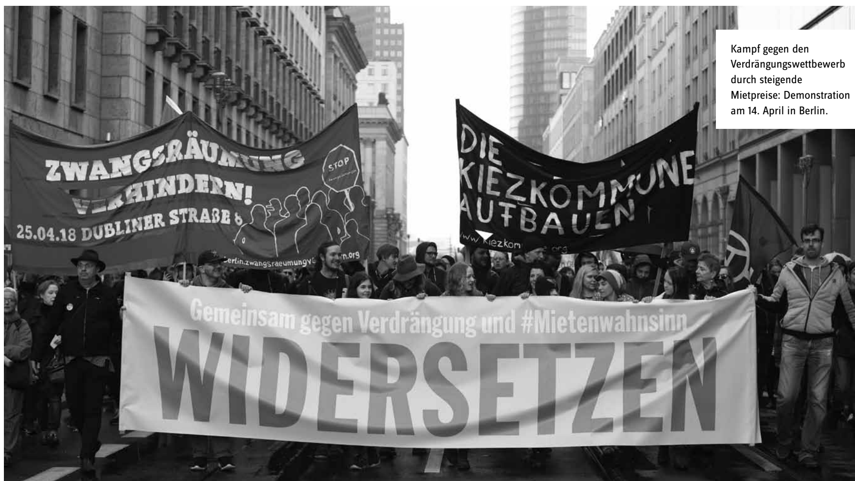
Kampf gegen den Verdrängungswettbewerb durch steigende Mietpreise: Demonstration am 14. April in Berlin.

Das Haus gehört zu einem von fünf Milieuschutzgebieten des Berliner Bezirks Mitte. In einem solchen Gebiet müssen Veränderungen an einem Gebäude, die dazu führen können, dass Mieterinnen und Mieter aus ihren Wohnungen verdrängt werden, von der Bezirksverwaltung erst genehmigt werden. Darüber hinaus kann der Bezirk ein Vorkaufsrecht in Anspruch nehmen. Zunächst legt er dem potenziellen Käufer eine Abwendungserklärung vor. So kann der Bezirk den Käufer dazu verpflichten, Luxussanierungen zu unterlassen. Weigert sich der private Käufer, die Erklärung zu unterzeichnen, kann der Bezirk eine kommunale Wohnungsgesellschaft mit dem Kauf beauftragen – oder einen Verein wie „AmMa 65“.