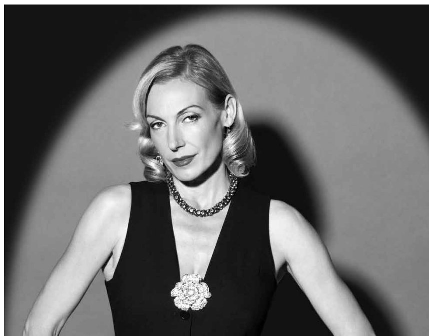
Kann mehr als nur Kurt Weill: Die deutsche Chanson-Sängerin Ute Lemper tritt an diesem Samstag, dem 21. April im Trifolion auf.