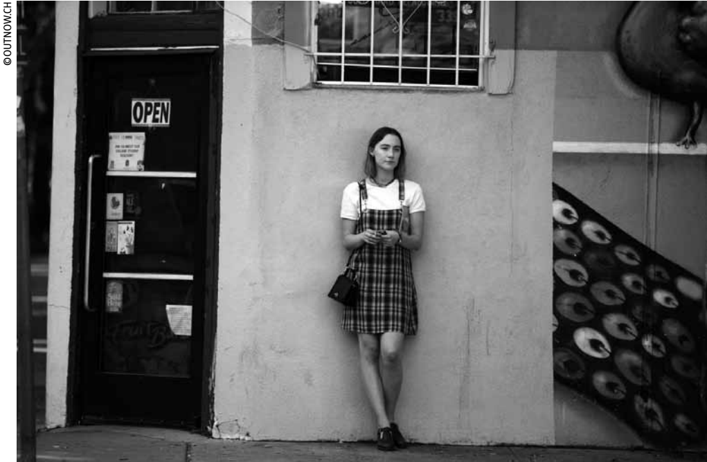
Für ihre Rolle in „Lady Bird“ erhielt die irische Schauspielerin Saoirse Ronan eine Oscarnominierung.