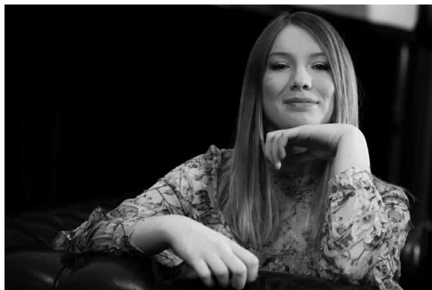
Ancienne candidate de « The Voice » en Belgique, Blanche se produira le 25 avril à la Rockhal.

Selah Sue , reggae/pop, Arsenal, Metz (F) , 20h. Tél. 0033 3 87 39 92 00. www.arsenal-metz.fr