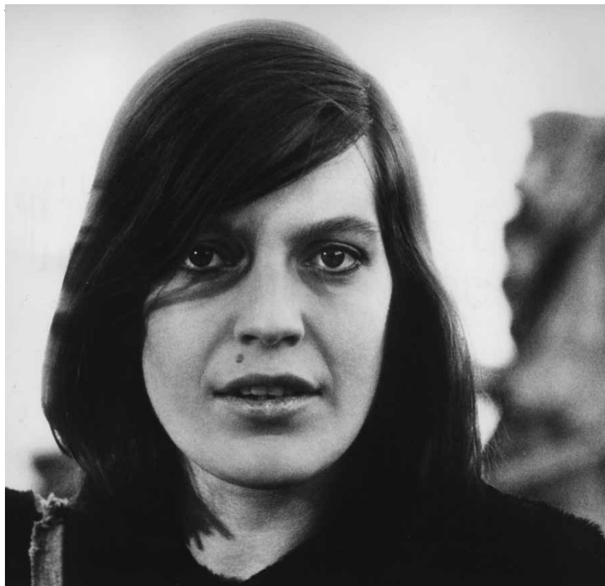
Mit Volker Schlöndorffs „Die verlorene Ehre der Katharina Blum“ ist es gleich doppelt wert sich am 23. April in der frisch entwanzen Cinémathèque einzufinden.

Auf einer Flugreise trifft der 50-jährige Unesco-Ingenieur Walter Faber auf den Bruder seines Studienfreundes Joachim Henke. Dieser hatte Fabers Jugendliebe Hannah geheiratet, doch bevor er ihn besuchen kann, begeht Joachim Selbstmord. Fabers Leben gerät ins Wanken. Auf einem Schiff nach Europa lernt er die 20-jährige Sabeth kennen. Fasziniert begleitet er die junge Frau und die beiden nähern sich an.