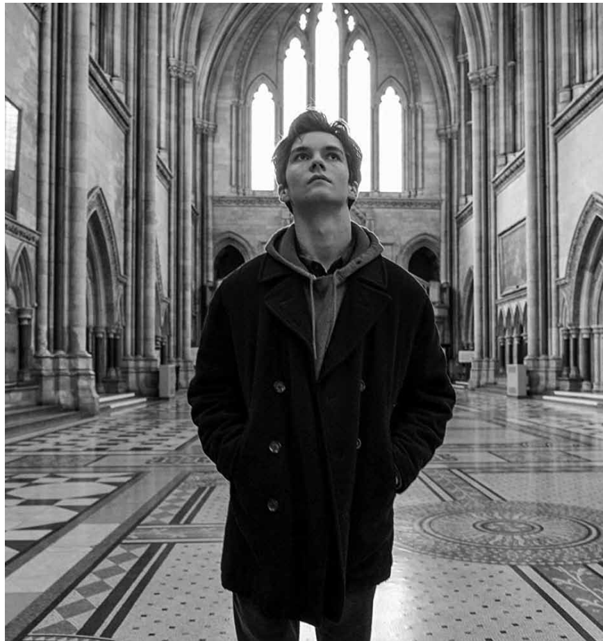
Wenn religiöse Dummheit auf die Justiz trifft: „The Children Act“ – neu im Utopia.

Kinepolis Belval und Kirchberg Jedes Jahr dürfen alle Einwohner*innen des Landes für zwölf Stunden tun und lassen, was sie wollen. Es gibt keine Gesetze, bloß Anarchie. Jeder ist für sich selbst verantwortlich und muss sich in Sicherheit bringen, vorausgesetzt er oder sie gehört nicht zu denjenigen, die sich mitten in der Nacht auf die Straße trauen, um ihre bestialischen Triebe auszuleben.