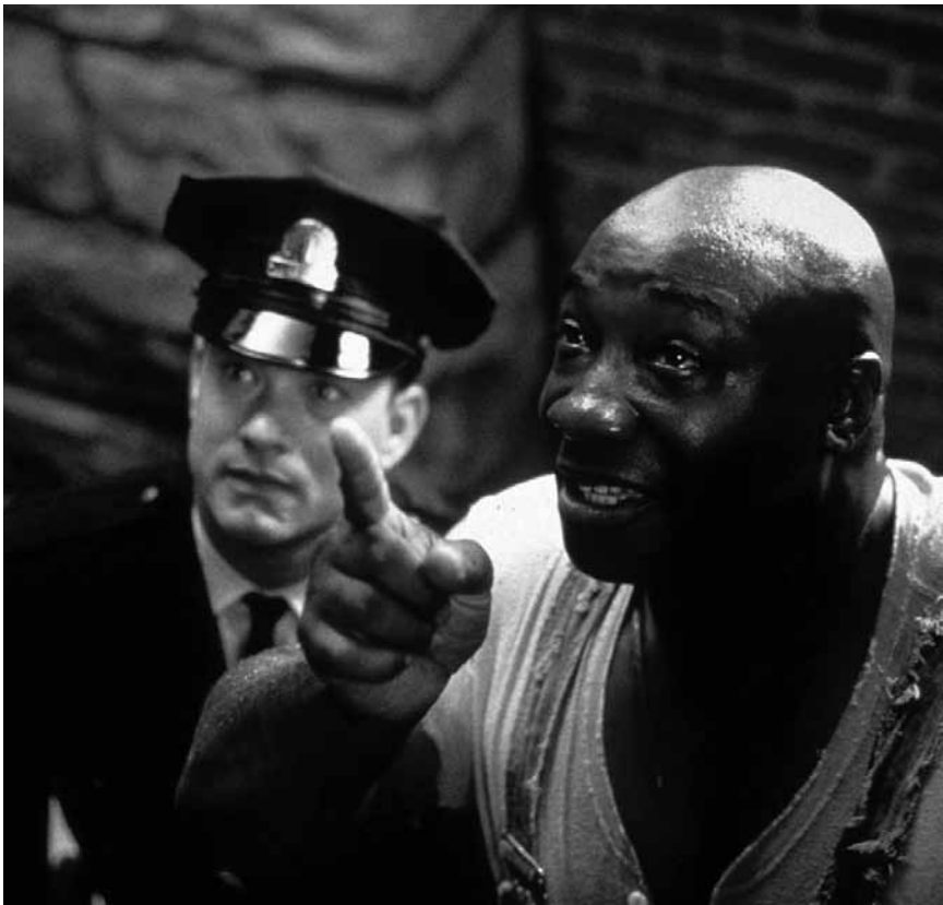
Nach Stephen Kings Roman: „The Green Mile“ ist zwar kein Meilenstein, bleibt aber doch ein Sci-Fi-Klassiker – am 14. August in der Cinémathèque.

À Boston, au 19e siècle, Olive, militante féministe, tente de rallier à sa cause Verena, jeune femme possédant de remarquables dons d'oratrice. Verena fait merveille jusqu'au jour où elle s'éprend d'un jeune avocat fortement opposé à ses idées d'émancipation.