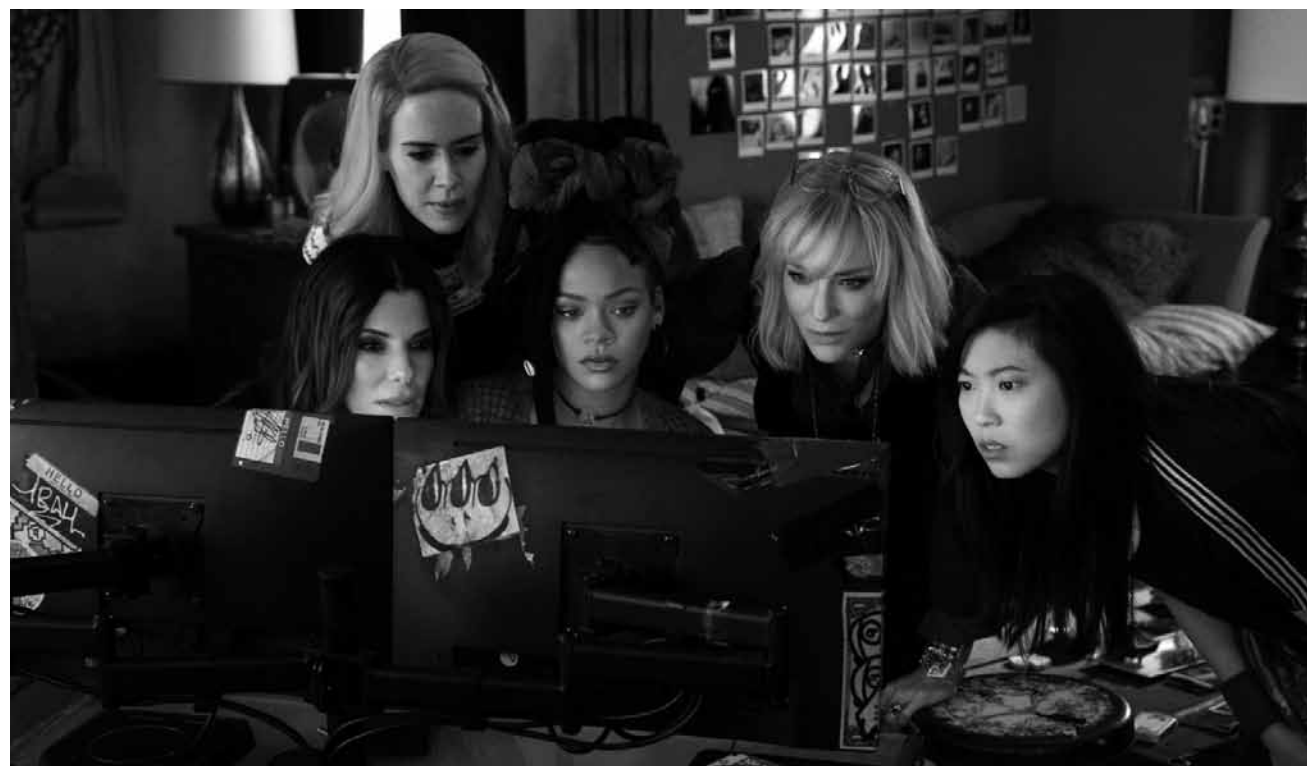
Nach den Ghostbusters erhält nun auch die Gangstersaga um Danny Ocean ein feminines Reboot: „Oceans 8“ - neu in fast allen Sälen.

Der quirlige Hase Peter ist ebenso rebellisch wie charmant und hält nicht sonderlich viel davon, Regeln