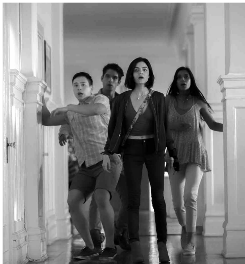
Ein altes Teenager-Mutspiel erhält ganz neue Dimensionen in „Truth or Dare“ – neu im Kinopolis Belval und Kirchberg.

Als die deutschen Truppen 1942 auf dem Vormarsch nach Paris sind, gelingt es Georg, rechtzeitig nach