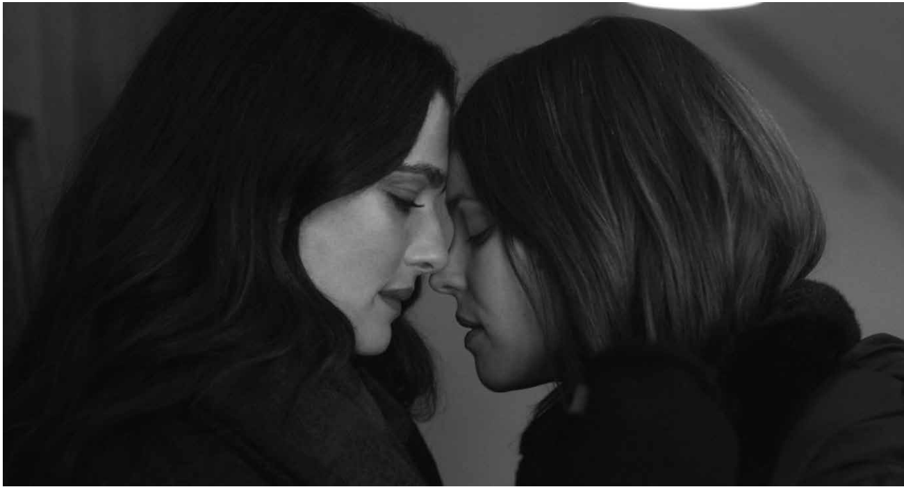
Ronit (Rachel Weisz) und Esti (Rachel McAdams) dürfen ihre Gefühle füreinander nur im Verborgenen ausleben.