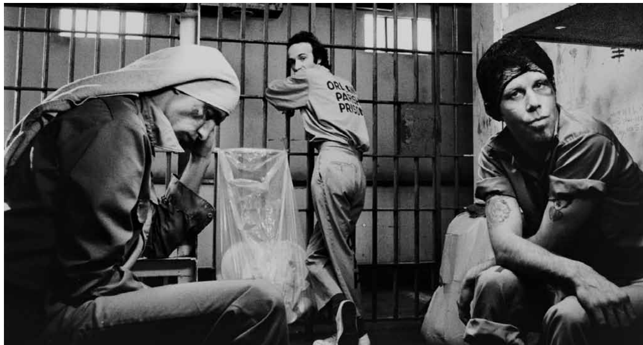
Jarmusch, Waits, Lurie und Benigni... was braucht man mehr um sich in der Cinémathèque am Samstag, dem 23. Juni „Down by Law“ mal wieder reinzuziehen?