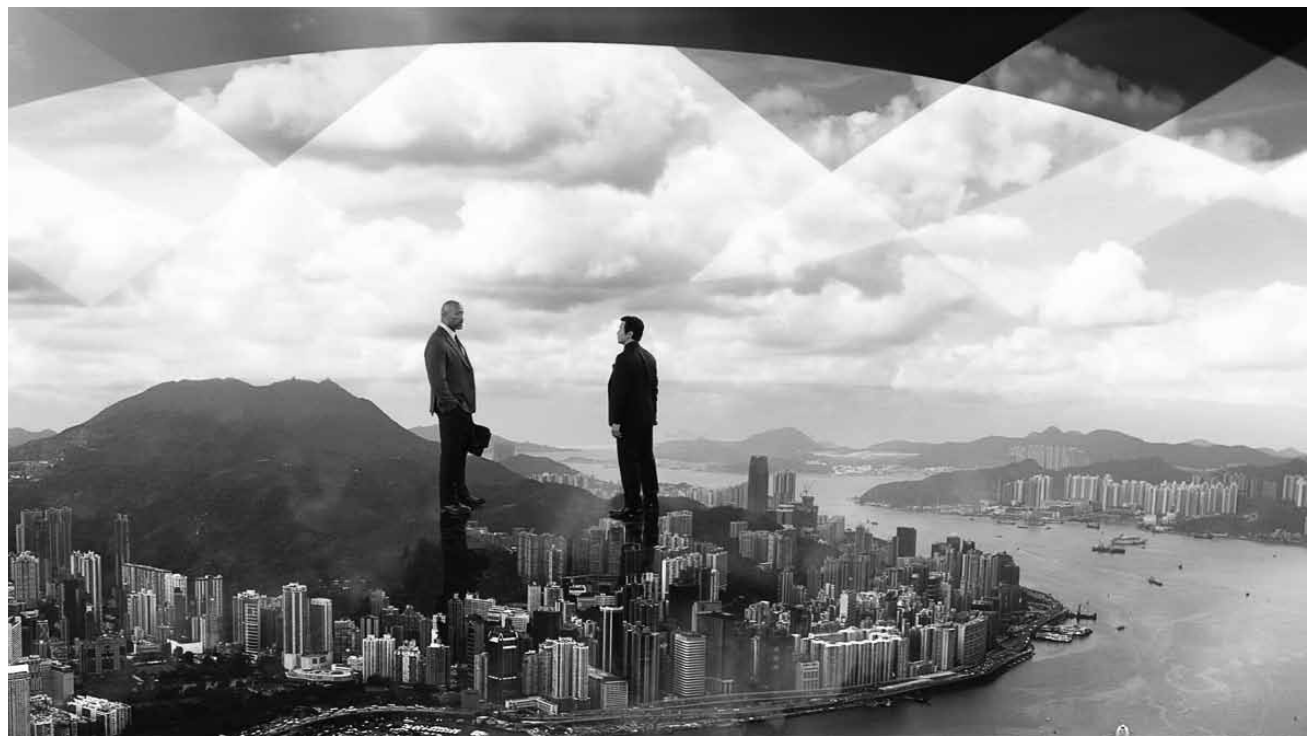
Huch! Ein Hochhaus, Terroristen und viel Rumgeballere ... da fehlt eigentlich nur noch Bruce Willis! In „Skyscraper“ übernimmt aber freundlicherweise Dwayne Johnson die Rolle - neu in fast allen Sälen.

Eigentlich wollten George, Julian, Dick, Anne und Timmy, der Hund ja nur einen gemeinsamen Strandurlaub verbringen. Doch zwei verdächtige Tierfilmer und ein merkwürdiger Tourist, der sich als Regierungsagent