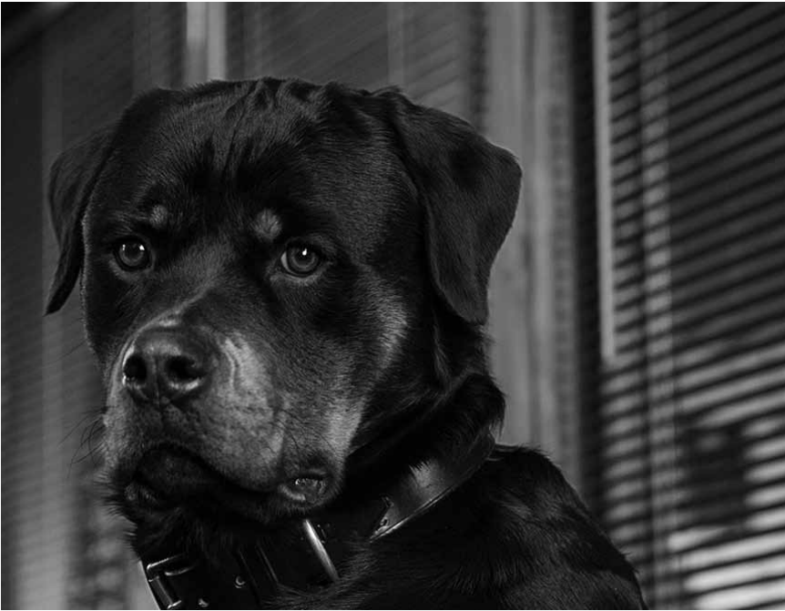
Sprechende Hunde müssen einen gekidnappten Panda finden: „Show Dogs“ - neu im Kinopolis Belval und Kirchberg.