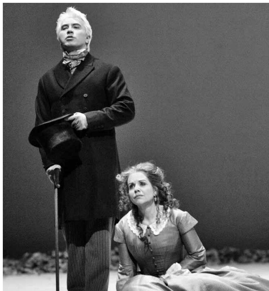
"Eugène Onegin" - Tchaikovsky's opera about a young love destined to fail (based on Alexander Pushkin's verse novel) will be shown at the Utopia on this Saturday, July 14th.