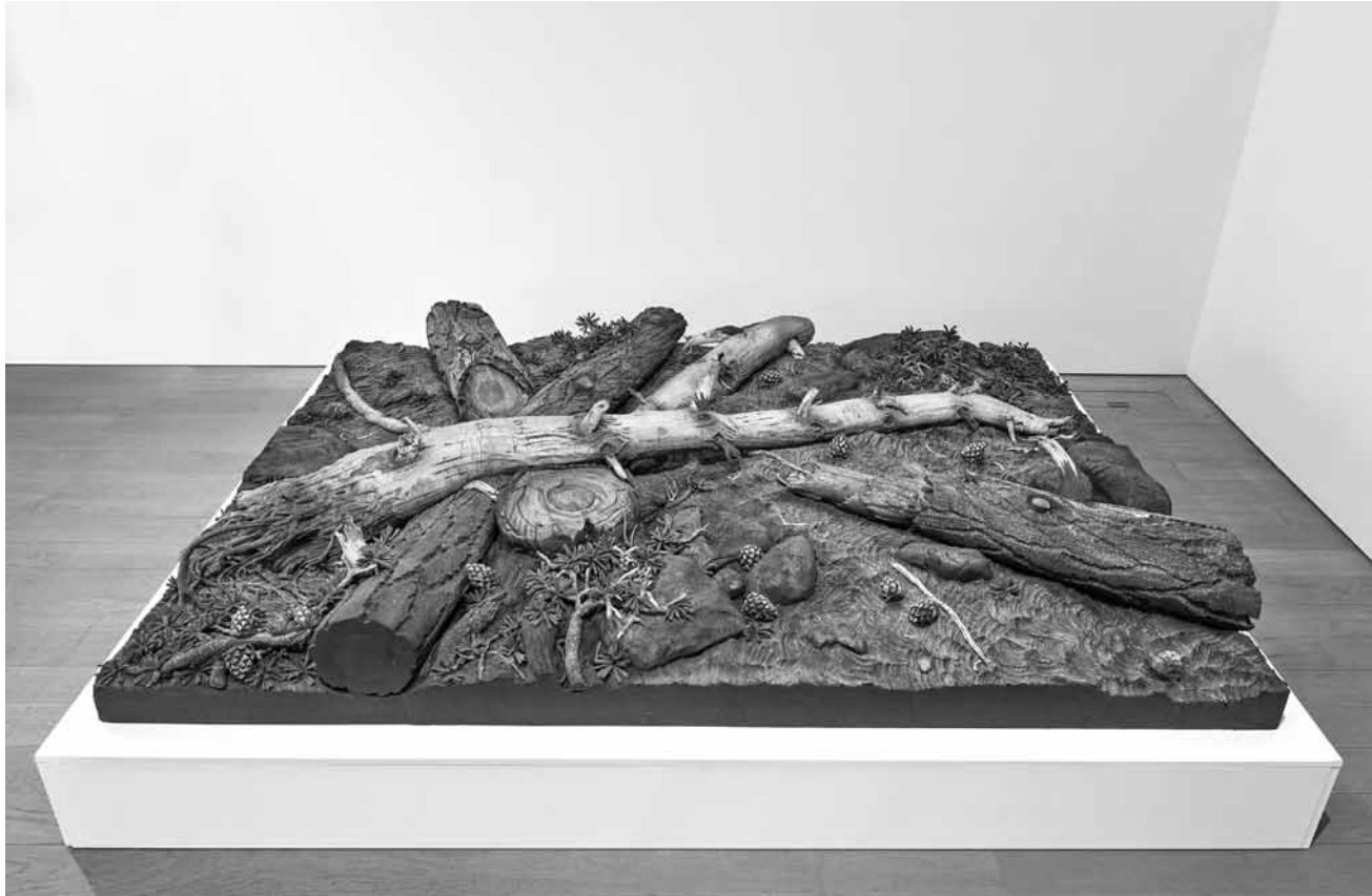
Un peu restreint le « No-Man's Land - Espaces naturels, terrains d'expérimentation »... L'expo collective (ici avec une œuvre de Piero Gilardi) est à voir au Mudam jusqu'au 9 septembre.