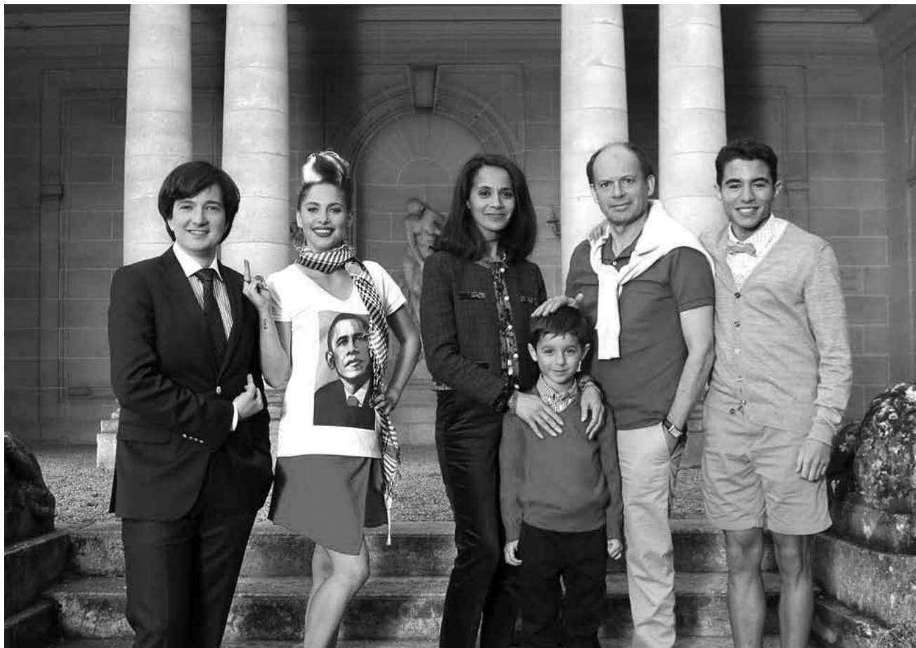
« Neuilly sa mère, sa mère » - ou plutôt : rendez-vous en terre inconnue à Nanterre pour une famille de riches bourgeois : la comédie de Gabriel Julien-Laferrrière est nouvelle au Kinopolis Kirchberg.