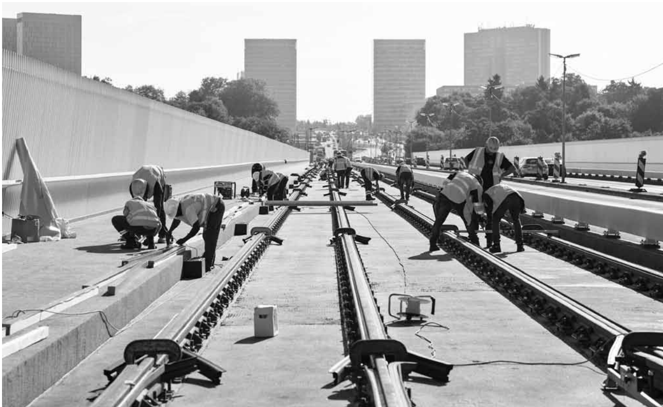
Passera ou passera pas ? Le photographe Romain Girtgen a accompagné le « Pont rouge - l'adaptation » avec sa caméra. Au Luca du 21 septembre au 20 octobre.