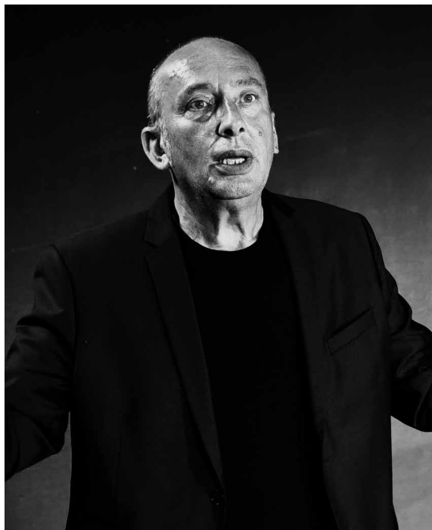
Le Théâtre Le 10 ouvre la saison avec une heure trente d'extraits joués par une ribambelle de comédien-ne-s : « Final Cut », mise en scène de Jean-Paul Bissieux – le 15 septembre.

Sie organisieren eine Ausstellung oder eine Veranstaltung und möchten diese in der woxx ankündigen? Schicken Sie alle wichtigen Informationen an agenda@woxx.lu Einsendeschluss für die Nummer 1494 (21.9. - 30.9.): 19.9., 9h.