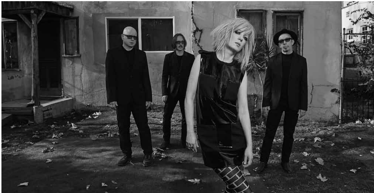
Garbage, toujours d'aussi bonne humeur après 23 ans de carrière.