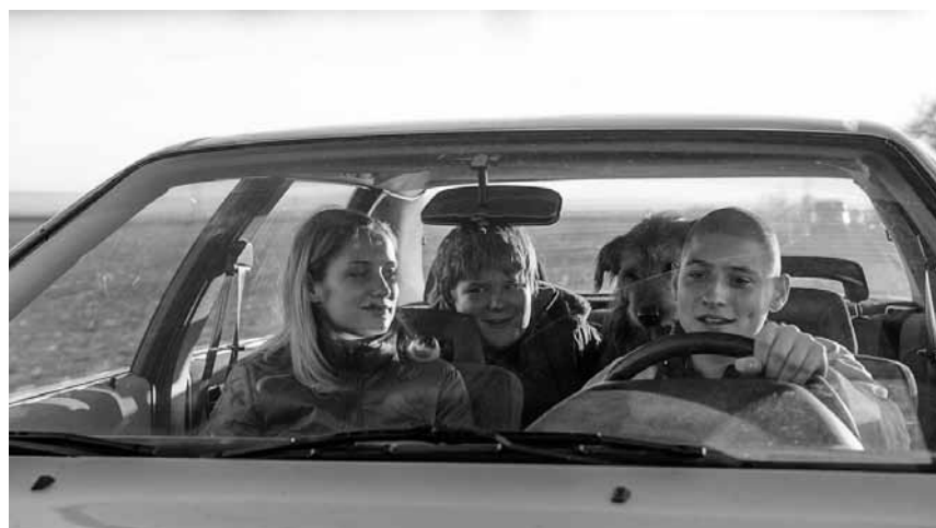
A rebellious youth on the Czech countryside: "Všechno bude"- on October 11th at the Utopia, part of the CinEast Festival.

Released under the title "235.000.000 Faces", this remarkable film came out in 1967, the year that marked the 50th anniversary of the October Revolution and the founding of the Soviet Union. The number 235 million refers to the 1966 population