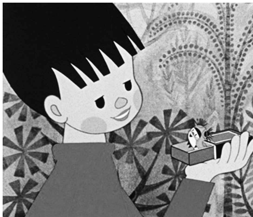
Even if it was meant for kids, the animated movie "Sametka" (a Czech-Russian production from the late 1960s) still has a psychedelic appeal - at the Cinémathèque on October 14th.

"Lemonade Joe or the Horse Opera" is a Czechoslovak musical comedy film that tells the story of a clean-living, soft-drink-selling gunfighter who takes on a town full of whiskey-drinking cowboys.