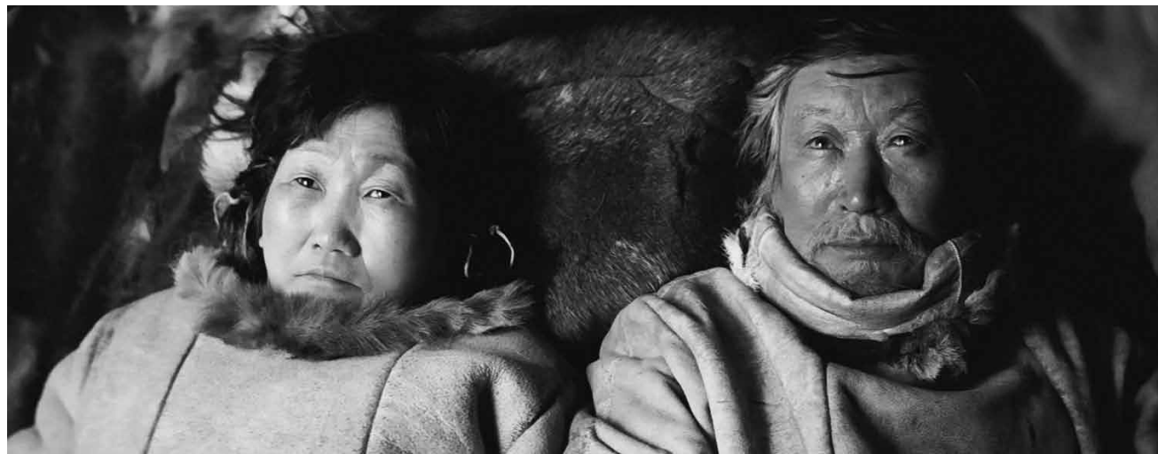
When traditional lifestyles fade away and the kids leave their parents, tough decisions have to be made: "Ága" - at the Cinémathèque on October 9th - part of the CinEast Festival.

Six stories about ordinary people put in extreme situations, which cause them to experience a panic attack: A woman meets her two exes during the same night, a couple pick the worst seat on an airplane, a young girl risks having her girlfriends expose her as a porn star, a bride gives birth at her own wedding, a teenager gets stoned for the first time and a young man has to beg his weird mother to save his life's work.