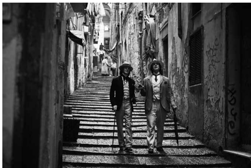
Oscar Wildes wildes Leben: „The Happy Prince“ kommt auf den Skandal um die Homosexualität des legendären Schriftstellers zurück – neu im Utopia.

2001: Die elfjährige Parvana wächst im von den Taliban kontrollierten Afghanistan auf. Als ihr Vater ungerechtfertigt verhaftet wird, schneidet sie sich die Haare ab und kleidet sich wie ein Junge, um ihrer