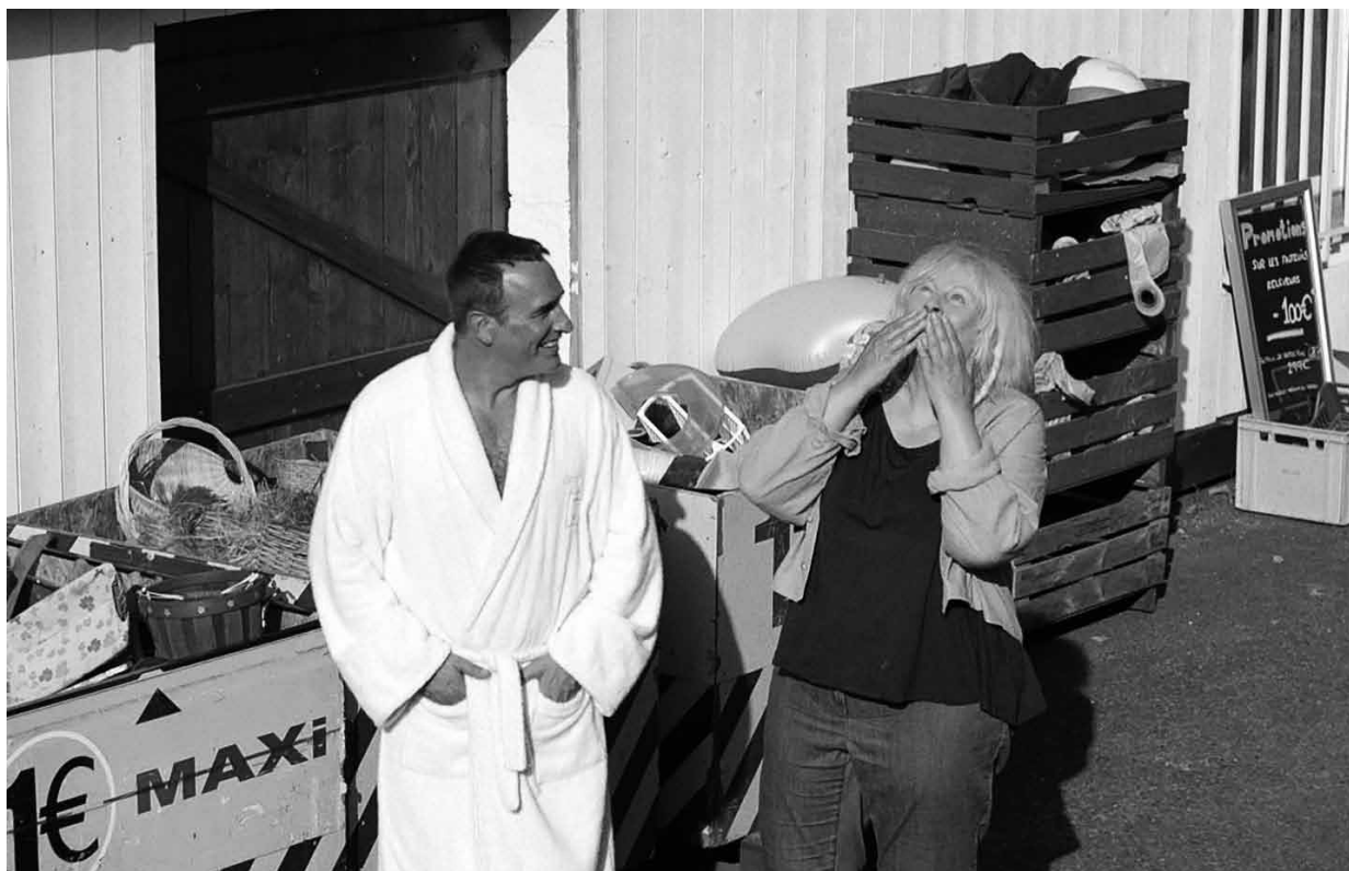
Une sœur et un frère pas comme les autres.