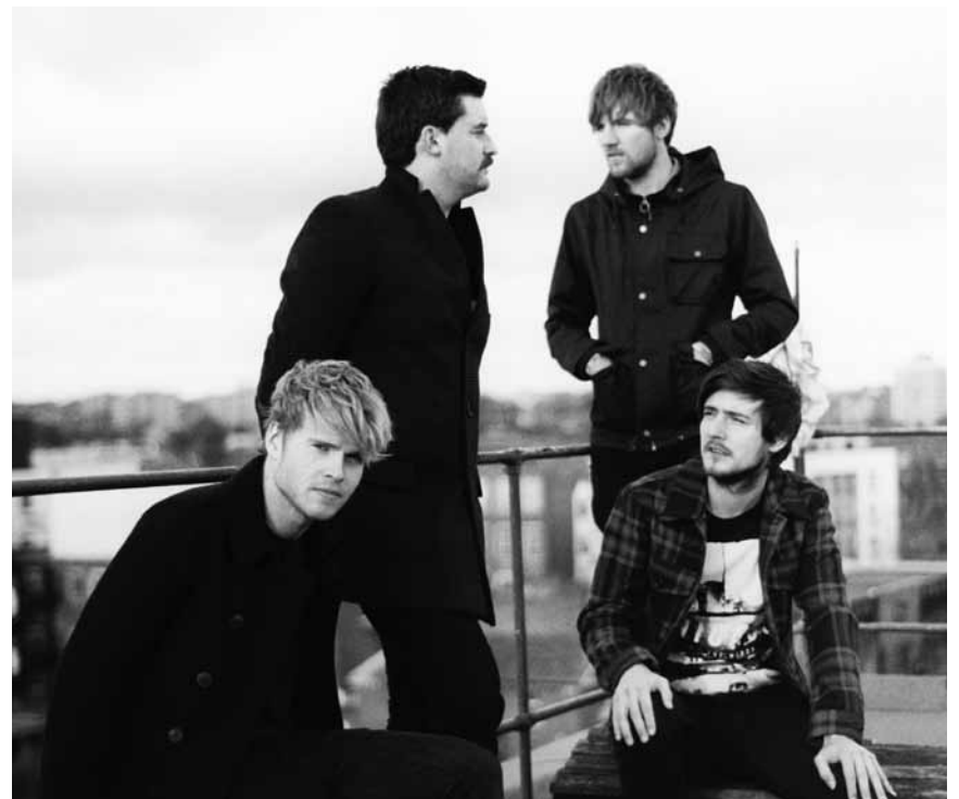
Ils sont beaux, ils sont jeunes et... irlandais : Kodaline viendra ravir les fans de l'indie pop ce vendredi 5 octobre à l'Atelier.