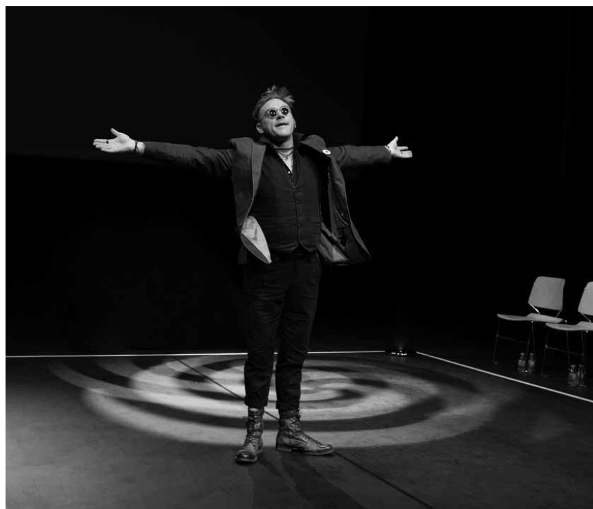
Et au théâtre « Le 10 » on improvise, mais pas n'importe comment : « Les pythékaros », troupe sportive d'Arnouville (c'est dans le Val-d'Oise) viendront chauffer les planches le 6 octobre.

Graveyard , psychedelic stoner rock, support: Bombus, Den Atelier, Luxembourg , 20h. Tel. 49 54 85-1. www.atelier.lu