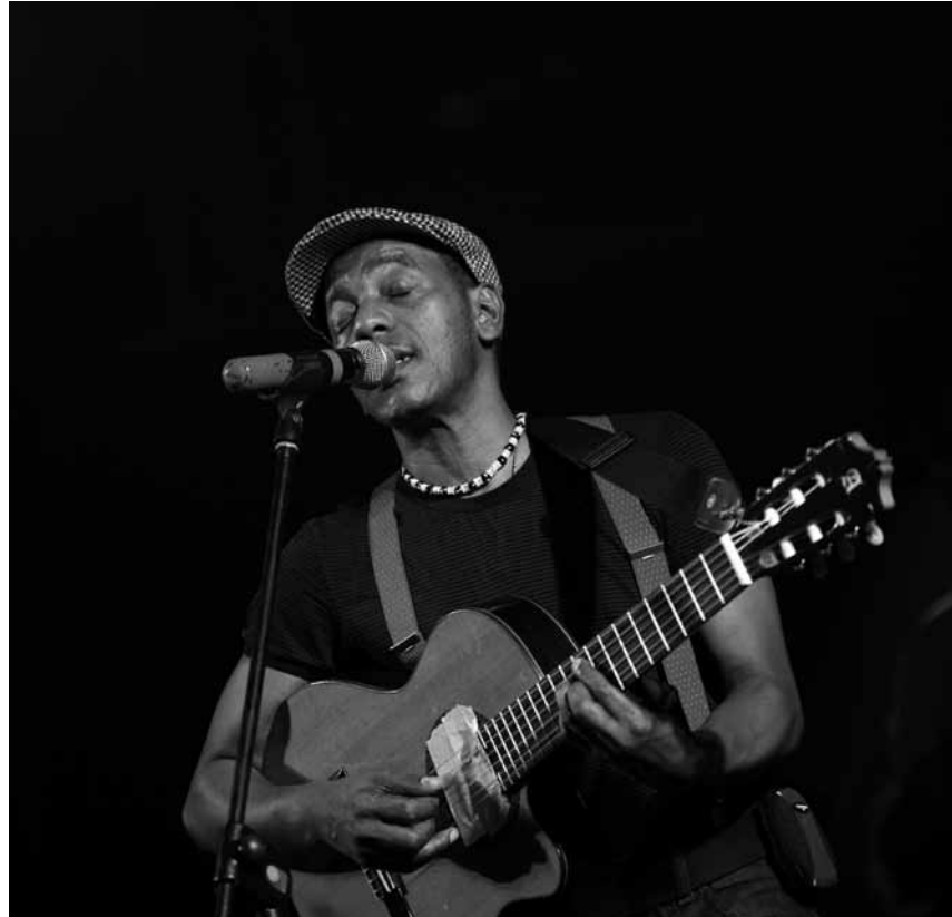
Tito Paris bringt die Kapverden nach Luxemburg.