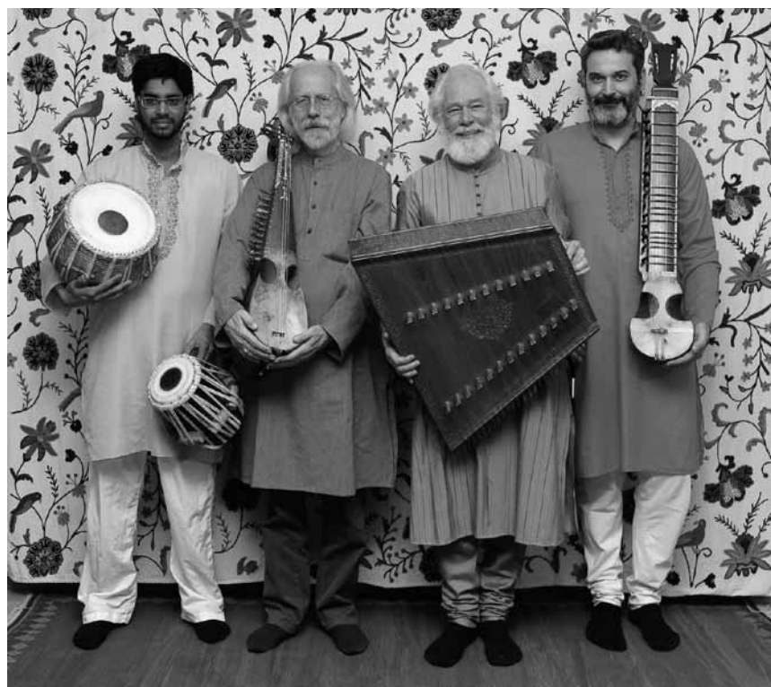
Un petit voyage en Inde et en Afghanistan ? L'ensemble Nuryana vous y emmène, le 12 octobre à l'Arsenal de Metz.

Funny Bones , projection du film de Peter Chelsom (USA 1995. 128'), Kinosch, Esch, 18h30. www.kulturfabrik.lu Inscription obligatoire : inscriptions@kulturfabrik.lu ou