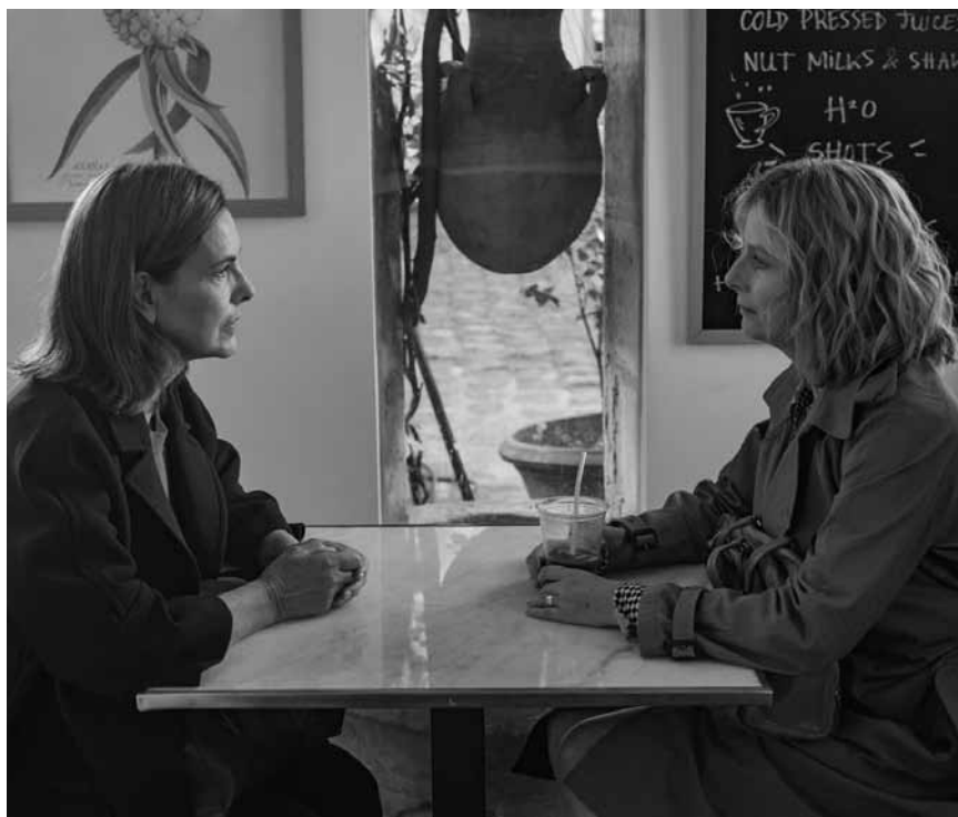
De débrouille en catastrophe : la vie précaire est au centre de la nouvelle comédie « Voyez comme on danse » - à l'Utopia.

Aliens, bis dräi Ausserierdescher direkt viru senger Nues landen. Domat fänkt fir de Jong eng aussergewöhnlech a geféierlech Aventure un.