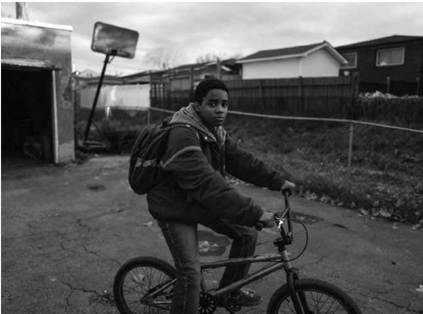
Alien-Waffen, böse Gangster und komplizierte Familienverhältnisse: In „Kin“ geht so Einiges – neu im Kinepolis Belval und Kirchberg.

Un ancien garde du corps qui enchaîne les petits boulots de sécurité dans des boîtes de nuit pour élever sa fille de 8 ans se retrouve contraint de collaborer avec la police. Sa mission : infiltrer l'organisation d'un dangereux chef de gang flamand.