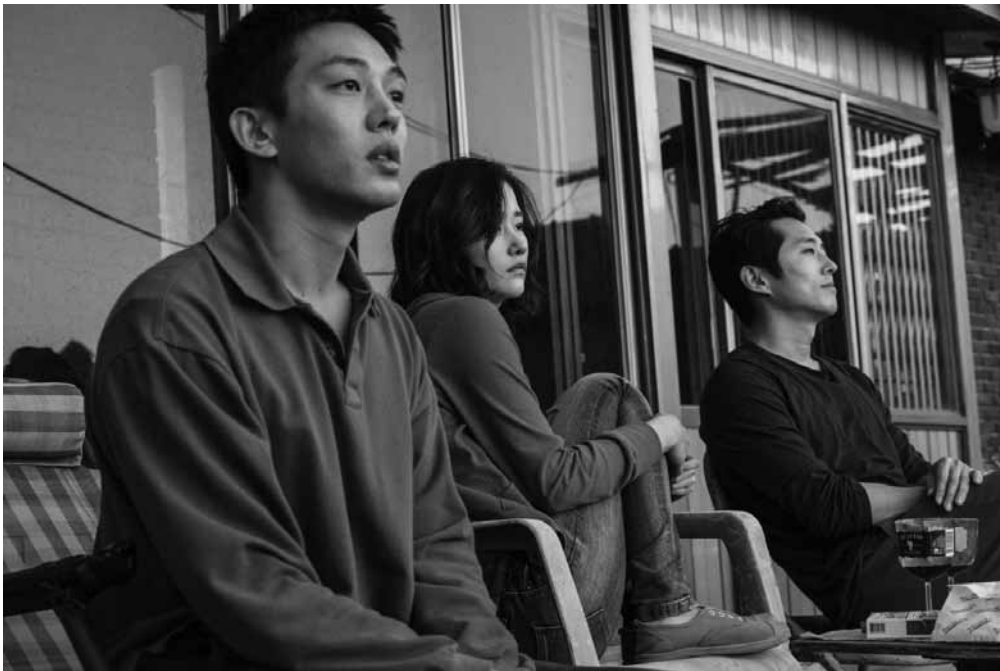
Un triangle amoureux qui va se démêler de façon surprenante.