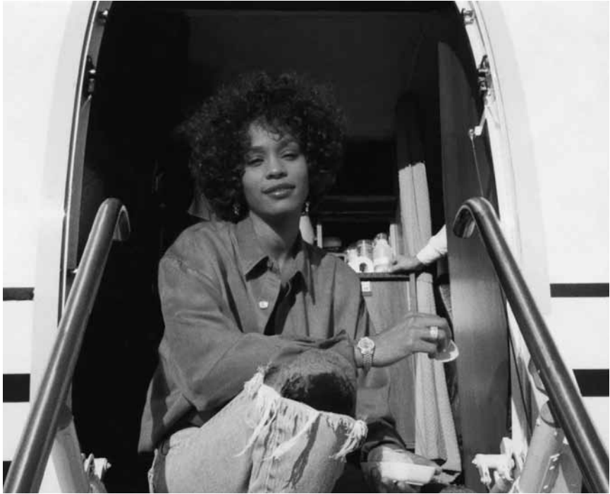
Wenigstens kein Biopic: „Whitney“ ist die erste genehmigte Doku über die verstorbene R'n'B-Sängerin Whitney Houston – neu im Utopia.

Das Oberhaupt der katholischen Kirche beantwortet Fragen zu verschiedenen Themen wie Wirtschaft, Immigration, soziale Ungerechtigkeit, Familie und Glauben, die ihm von Menschen überall auf der Welt gestellt wurden.