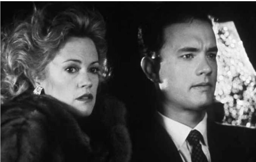
Hanks gegen Willis – und das nicht in einem Action-Film: „The Bonfire of Vanities“ von Brian De Palma – am 10. September in der Cinémathèque.

In seiner Dokumentation nimmt Kevin Macdonald einen tiefen Einblick in das Leben und die Musik des Stars Whitney Houston. Der Film ist das erste von den Nachkommen der Sängerin offiziell genehmigte Projekt.