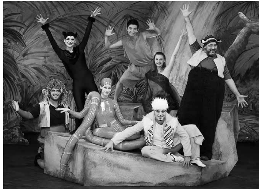
Versuchs doch mal mit Gemütlichkeit! Das Dschungelbuch-Musical kommt an diesem Freitag, dem 14. und an diesem Samstag, dem 15. Dezember ins Trifolion nach Echternach.