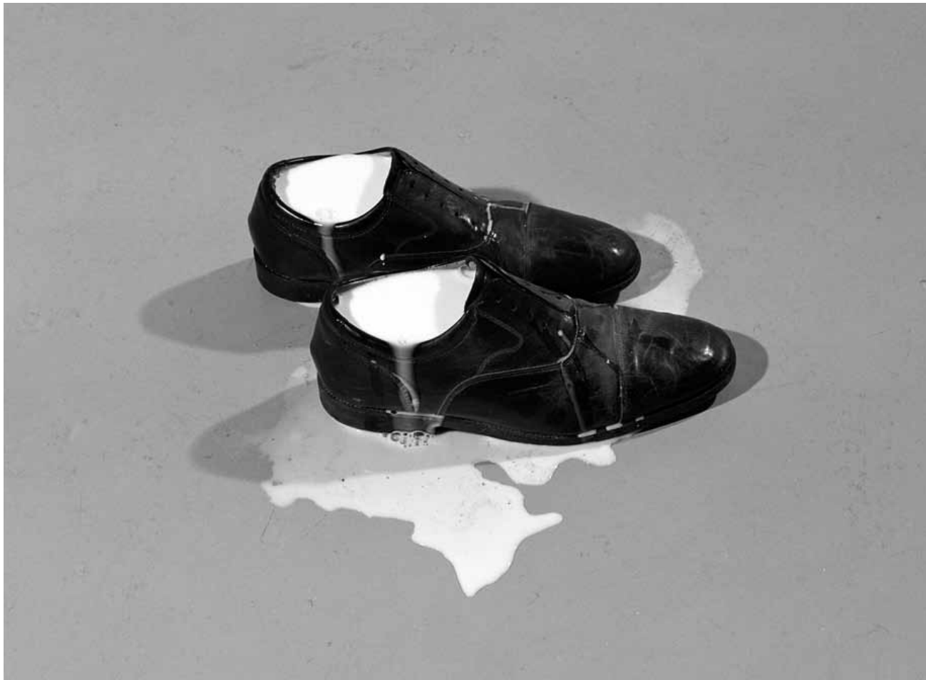
Qui ne connaît pas le problème des souliers pleins de lait ? « Les corps du sol » - photographies de Patrick Tosani, du 18 janvier au 17 mars à l'Arsenal de Metz.