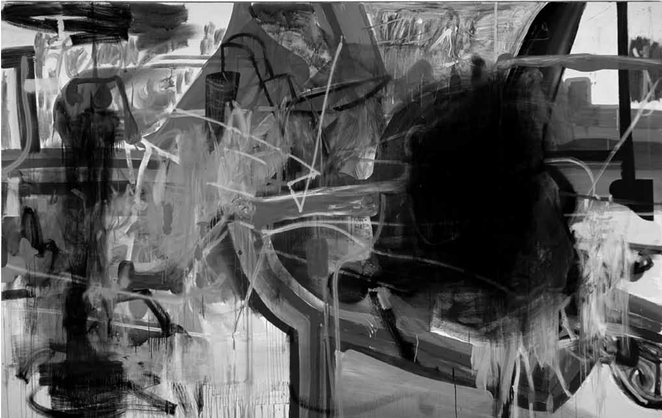
Le Mudam a sorti les « bonnes feuilles » de ses réserves avec l'expo « Peintures des années 1980 et 1990 » - ici une œuvre d'Albert Oehlen -, visible jusqu'au 7 avril.

Les origines de la civilisation chinoise trésors archéologiques du Henan, Musée national d'histoire et d'art (Marché-aux-Poissons. Tél. 47 93 30-1), jusqu'au 29.4, ma., me., ve. - di. 10h - 18h, je. nocturne jusqu'à 20h.