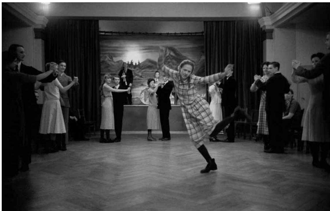
Wildes Herumtanzen in der muffigen schwedischen Provinz: Auch die junge Astrid Lindgren war schon... etwas anders.