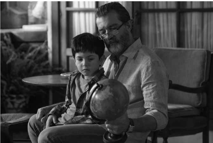
Eine Liebes- und Lebensgeschichte die sich über mehrere Generationen spannt: „Life Itself“ – neu im Kinopolis Kirchberg und im Scala.

I 2018 de Paolo Sorrentino. Avec Toni Servillo, Elena Sofia Ricci et