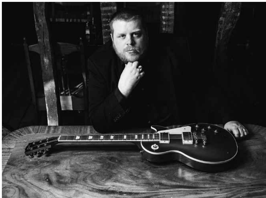
Von der Big-Band zum Trio: Der britische Bluesman Danny Bryant lässt nichts unversucht um sein Publikum mitzureißen – am 23. November im Duksaal in Freudenburg.

Korb , musikalisches Märchen von Joël Jouanneau, Werkstattinszenierung mit anschließendem Publikums-gespräch, Alte Feuerwache, Saarbrücken (D), 19h. Tel. 0049 681 30 92-486. www.staatstheater.saarland Im Rahmen des Festivals Primeurs.