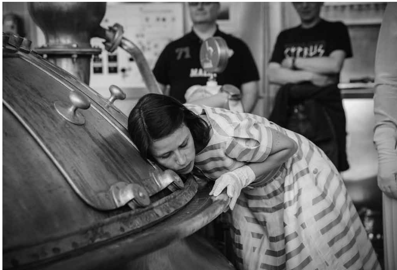
Mol Loscht net ze wëssen wat op een(t) duerkënnt? Dann ass „D’Kaz am Sak“ zu Woltz genau dat richteg - vum Kollektiv Maskénada an den Auteurs vun Hydre Editions, de 24. November am Prabbeli.