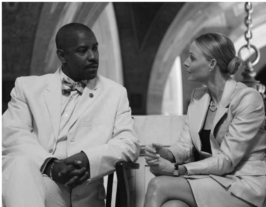
Spike Lees Ausflug in das Gangsterfilm-Genre „Inside Man“ – am Mittwoch, dem 5. 12. in der Cinémathèque.

Der Drogenhändler Monty Brogan wurde erwischt und zu einer Haftstrafe verurteilt. In genau 25 Stunden soll er sich zum Gefängnis begeben, um die verhängte Strafe zu verbüßen. Brogan nutzt die Zeit, um noch ein paar Dinge zu regeln, bevor die Außenwelt für einige Jahre der Vergangenheit angehört.